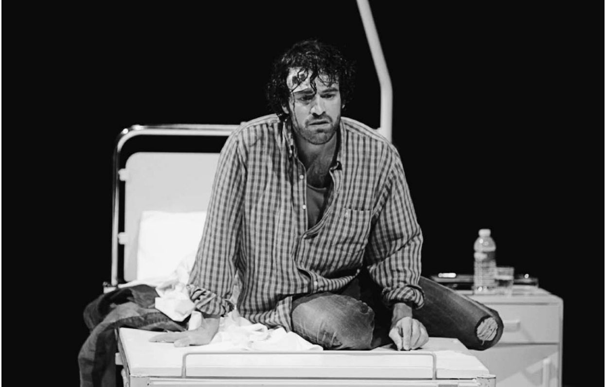
Romain Duris dans la Nuit juste avant les forêts de Bernard-Marie Koltès, mise en scène par Patrice Chéreau au Musée du Louvre en 2010 et reprise au Théâtre de l'Atelier l'année suivante.