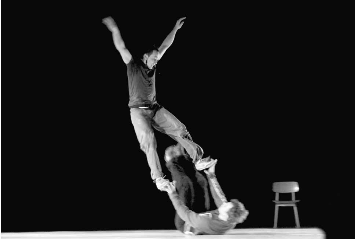
Appris par corps du duo Un loup pour l'homme, présenté à la Tohu en octobre 2009.

Les figures et mouvements qui composent ce qu'on appelle aujourd'hui le main à main sont d'origines variées et parfois anciennes. On imagine bien les portés avec des figures en souplesse ou en contorsion présents en Asie depuis des millénaires. Les pyramides et les colonnes auraient été utilisées par les Marocains pour voir l'ennemi arriver de loin et aussi lors de fêtes italiennes du XVIII e siècle où l'on rivalisait entre villages à savoir qui réaliserait la pyramide humaine la plus extraordinaire. En Occident, à la fin du XIX e siècle et au début du XX e , on parlait d'acrobates du tapis 3 , de sauteurs à terre ou de sauts en colonnes. De nos jours on voit couramment le main à main sous forme de duo, mais il arrive que des trios ou des formations plus nombreuses proposent aussi des numéros. Quant à Laissez-porter et Appris par corps , il s'agit de spectacles complets consacrés à la discipline.