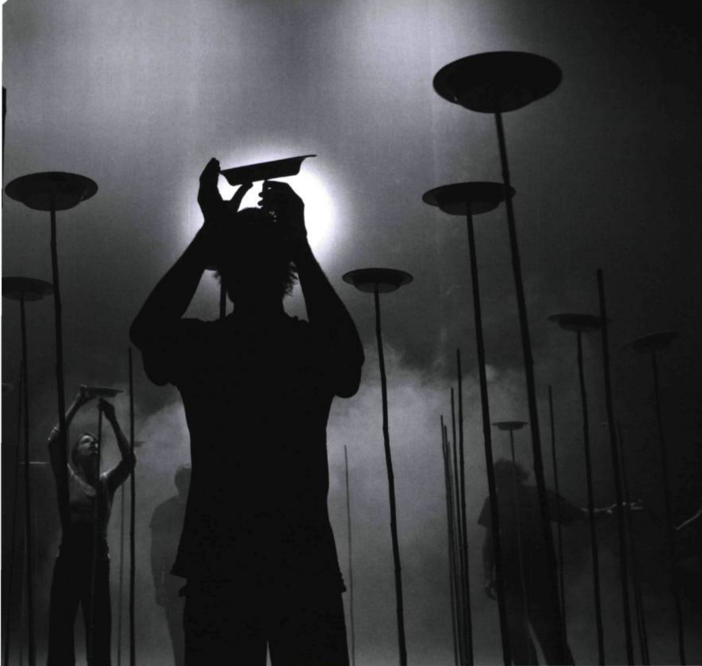
Nebbia , spectacle conçu par Daniele Finzi Pasca (Cirque Éloïze/Teatro Sunil) et présenté au TNM à l'automne 2008.