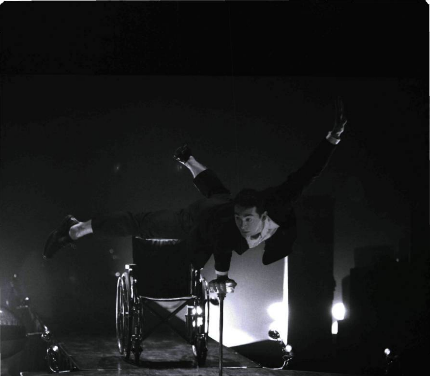
La Vie , création des 7 doigts de la main présentée à la Tohu à l'automne 2008, © Eric Pichet.