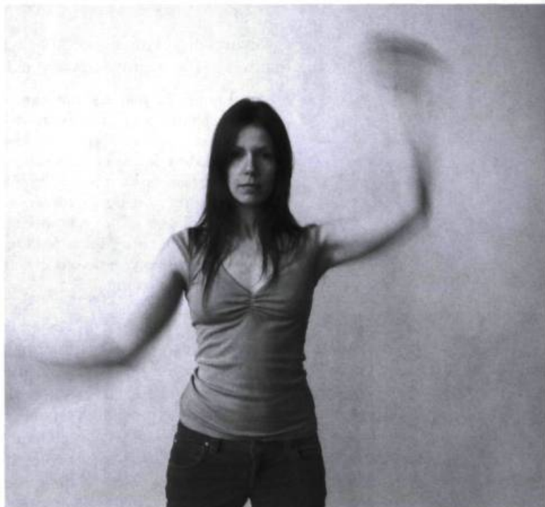
Sokrat de Karine Denault (L'aune), version solo présentée dans les maisons de la culture en avril 2006, à l'occasion du Printemps de la danse.