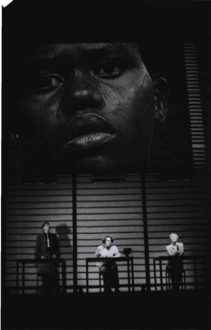
Rwanda 94 (Groupov, Belgique), présenté au FTA en 2001.

Les conditions de production sont telles, dans le théâtre institutionnel, que, même si un spectacle pose les bonnes questions – comme dans Rwanda 94 –, on peut se demander à qui il les pose. C'est à ceux qui ont déjà les réponses! À ceux qui font déjà les réponses. Tandis que le travail du théâtre d'intervention se définit aussi par ses conditions de production. Il est important de s'adresser aux gens qui subissent les réponses aux questions, donc qui subissent l'oppression.