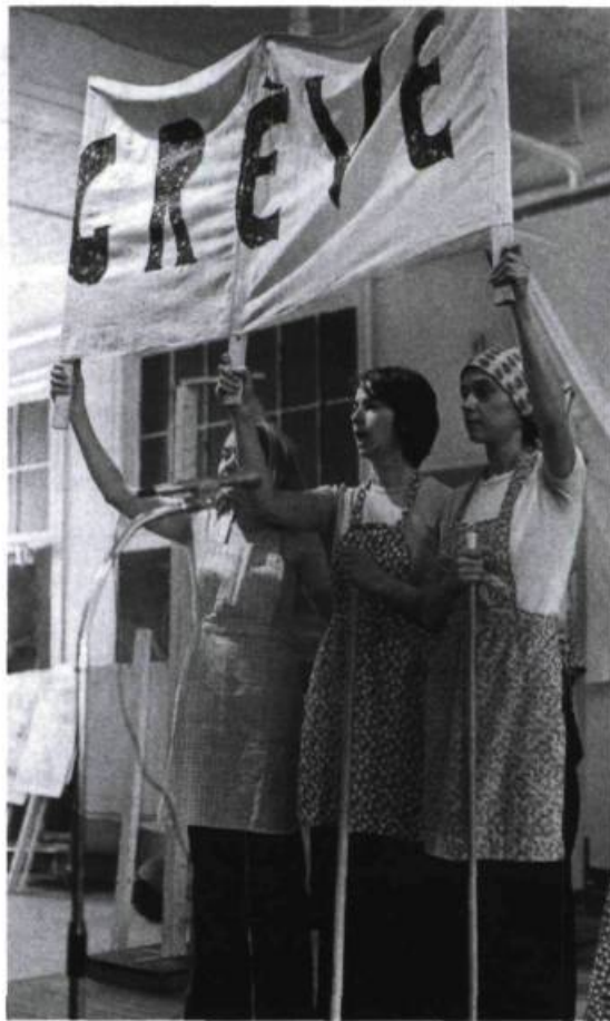
Môman travaille pas, a trop d'ouvrage du Théâtre des Cuisines (1975). Photo : Murièle Villeneuve.

Paul Biot note que l'on a parlé dans ce débat de professionnels, et que l'on a abordé un peu la notion de la parole des gens et donc de leur participation à la création. Il rappelle qu'en Communauté française de Belgique existe quelque chose d'extrêmement intéressant, soit la reconnaissance du travail professionnel de création avec des personnes. Ce travail est subventionné, car il donne la parole à des gens que l'on ne veut pas entendre habituellement. Il est donc ce que le théâtre doit être dans une société donnée : un lien. Il remplit ce rôle. Ce théâtre doit être reconnu comme une valeur intrinsèque de l'invention culturelle permanente. En fonction d'un certain nombre de critères qui sont apparus il y a à peine un siècle, on a favorisé uniquement un théâtre assurant une visibilité, non pas au théâtre mais à l'État. Le véritable objectif serait plutôt d'assurer une place à cette parole particulière, mais cela suppose d'assumer le caractère fondamentalement professionnel d'un tel travail de type théâtral. Il faut le valoriser, le revendiquer comme un travail professionnel. Si en Belgique