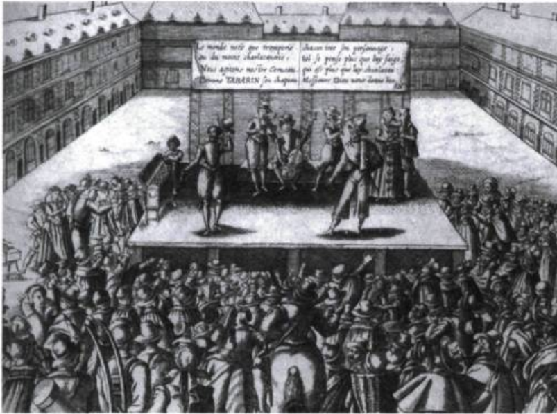
Les tréteaux de Tabarin, sur la Place Royale à Paris, en 1623.

l'autre, l'opium religieux, en regard du réel. La pub l'a compris et en profite grassement. Si l'image vaut mille mots, comme on dit parfois pour se montrer pédagogue à la page ou investisseur soucieux d'efficacité et de rendement, ne faudrait-il pas préciser la nature de ces mots plutôt que leur nombre ? En dépit de leur parenté, l'image ne nourrit pas tant l'imaginaire qu'il ne l'étouffe, mais non par fatalité, disons plutôt par conjoncture. À preuve le conformisme généralisé qui semble peser de plus en plus sur la « société du spectacle », sous la forme délétère de la rectitude politique ou de la passivité sociale et intellectuelle. Il n'est pas alors étonnant que la somptuosité scénographique à la mode s'accompagne d'une sorte de désaffection, voire de désinvolture, à l'égard de la gestion des mots (projection de la voix, diction, articulation, prononciation), s'il est vrai que le spectacle a pris le pas sur la théâtralité.