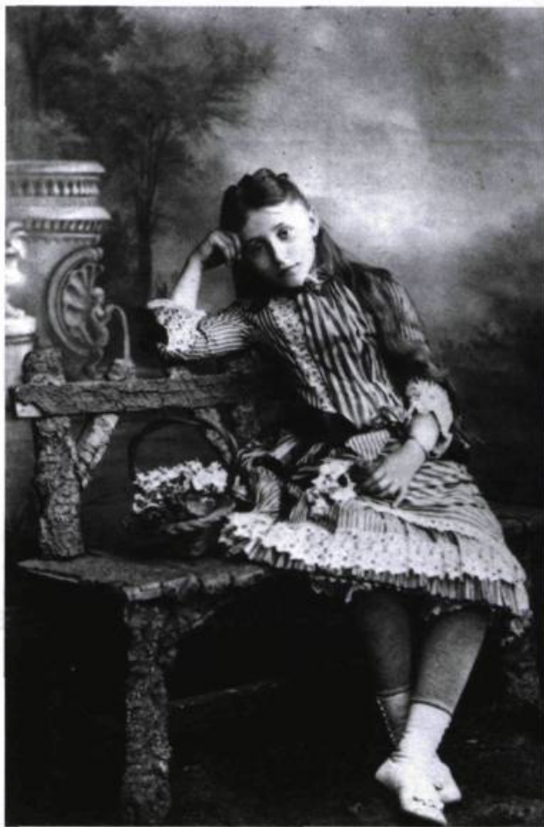
« Les premiers portraits photographiques imitaient les portraits sur chevalet, amorçant un bouleversement figuratif assez profond en peinture pour transformer, un demi-siècle plus tard, une tête en... cube ! » Photographie de Colette en 1886 (tirée de Amoureuse Colette , par Geneviève Dormann, Paris Herscher, 1984, p. 20) et Tête de jeune fille (1913) de Picasso (collection privée, Paris).

Après quoi, lorsque l'ambition de faire plus vrai que le réel aura gagné le cinéma (l'américain, tout particulièrement, puisque Naissance d'une nation de Griffith date de 1915 et Intolérance , de 1916 : le second film tentait de faire oublier que les