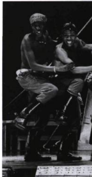
Gumboots , présenté au Festival Juste pour rire à l'été 2000.

Gumboots est une performance qui frappe d'abord par son énergie virile débordante, mais elle comporte aussi, pour qui lit entre les lignes, une tranche importante d'his-