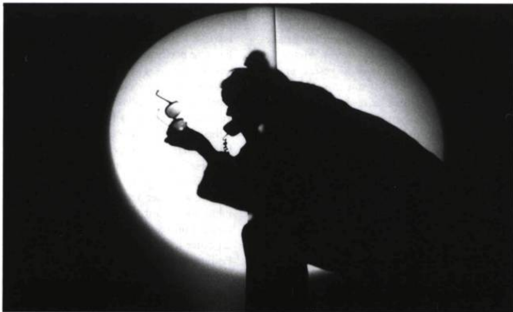
Les Portraits de la Renarde de Marcelle Hudon et Le groupe thriller à 5 €.

de l'événement nous ont tout de go plongés dans le bain de la création multidisciplinaire où la démarche est souvent plus importante que le résultat lui-même. C'est ce que je retiens surtout de ce Mois Multi. Ainsi, certains spectacles me semblaient inachevés. La production Lumens , qui était la première œuvre présentée à Québec, en est un exemple. Nous avions la possibilité de nous promener au centre d'une structure circulaire recouverte d'un matériau de plastique souple et dans laquelle une femme GI se trouvait emprisonnée. Si nous le désirions, nous pouvions également observer la scène de l'extérieur du cercle qui n'était pas complètement fermé. Cette sculpture de plastique, éclairée de l'intérieur, avait aussi la capacité de réfléchir la lumière des images vidéo projetées sur ses parois. Ces images provenaient d'un projecteur rotatif fixé au centre de la salle et de quelques autres posés aux quatre coins de la pièce. Cette immense masse lumineuse exerçait certes une fascination sur quiconque s'en approchait en entrant dans la salle de spectacle.