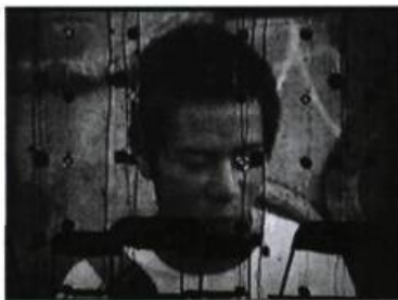
La Salle des nœuds II.1, installation de Jocelyn Robert et Émile Morin, créée à l'occasion du Mois Multi.

J'ai faim. Nous nous dépêchons de sortir et de revenir en vitesse avec des bagels que nous mangeons de bon cœur. Il faut tenir le coup pour la route. Trois heures et quelques centaines de kilomètres nous séparent de la première représentation de l'événement... À Québec. Dans l'autobus loué qui nous mène jusqu'à la capitale, c'est la fête. Un musicien gratte quelques