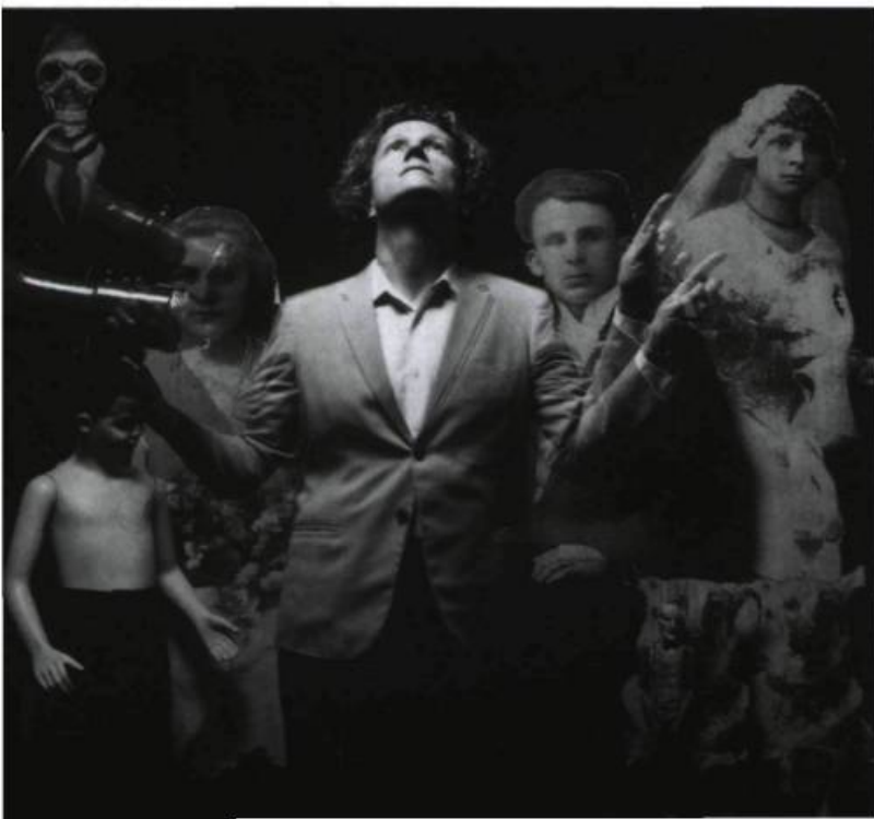
Triptych du Sound Image Theatre de Toronto.

Dans une perspective globale, le Mois Multi aura été l'occasion pour bien des spectateurs de se familiariser non seulement avec l'art multidisciplinaire, mais aussi avec l'art médiatique. Et dans ce domaine, tout reste à explorer. Pour le spectateur, l'expérience peut à la fois devenir fascinante et laborieuse. Il y a des spectacles où la technologie occupe tellement de place qu'on a plutôt l'impression d'assister à des démonstrations techniques de la part des artistes. À force de se demander comment ils ont construit l'œuvre, on oublie de se demander pourquoi ils ont choisi de le faire. Comme je le mentionnais plus haut, il faut souvent aller voir un spectacle en gardant à l'esprit qu'on assistera ou qu'on participera à un processus de recherche, et non qu'on observera une œuvre terminée, fermée. Toutefois, il existe des moments magiques où l'on se laisse emporter par le flot d'images hétéroclites. Dès lors, on perçoit à travers l'œuvre médiatique le reflet d'une société informatisée, le reflet d'un village global façonné de liens complexes et régi par des règles de plus en plus nombreuses. J