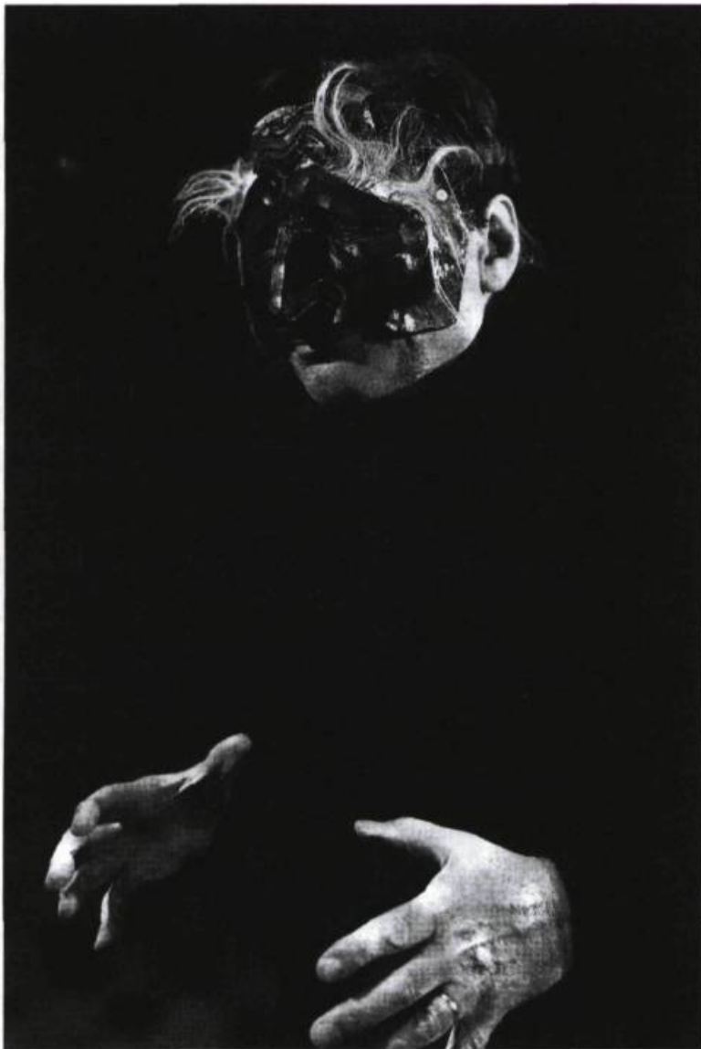
Masque de Pantalon, porté par Jacques Lecoq.

l'élève est amené à (re)découvrir son environnement, l'espace autour de lui. S'amorce alors un travail sur les éléments (eau, feu, air, terre), sur la matière (bois, papier, carton, métal), les couleurs, la lumière, auxquels l'élève s'identifie corporellement. C'est grâce à ce « fonds poétique commun » que l'imagination des élèves est sollicitée et que s'installe en eux le « corps mimeur », c'est-à-dire le corps capable de recréer la vie par le geste, pour la scène.