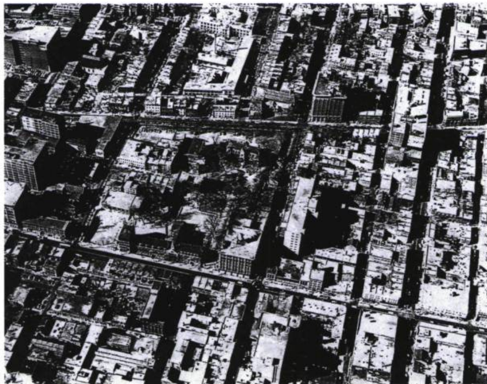
Le quartier du TNM, de la Place des Arts avant sa construction et du Red Light District dans les années cinquante, traversé par les rues Sainte-Catherine et Ontario horizontalement, et par les rues Saint-Laurent, Saint-Urbain, Clark et Jeanne-Mance verticalement.