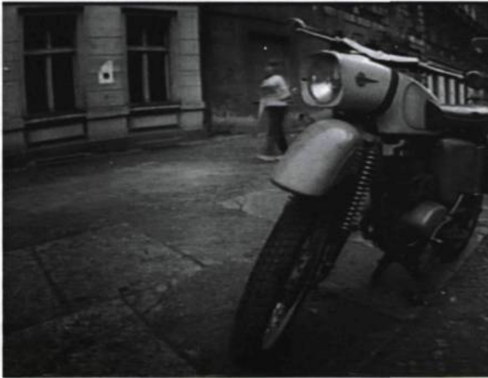
J'étais Hamlet , vidéo de Dominik Barbier (France, 1994, 73 min).

l'autre (comme c'est le cas des arts d'interprétation ; plus étonnant, on parle maintenant de « sculptures vidéo »). Or, la possibilité d'explorer la représentation par des combinaisons transdisciplinaires semble parfois si intéressante que le travail traditionnel — déjà fort complexe — de la création théâtrale peut en être profondément affecté. Les acteurs de ces nouveaux rôles, embusqués derrière leurs machines, ont changé de peau... Sont-ils vraiment des créateurs ou bien, engoncés dans leur haute spécialité, sont-ils de nouveaux technocrates qui manipulent aveuglément les arcanes de la création ? Le succès sans précédent du multimédia invite à y réfléchir.