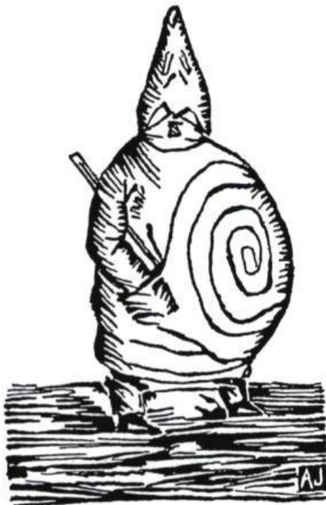
Le Père Ubu et sa gidouille (son ventre). Gravure sur bois de Jarry.