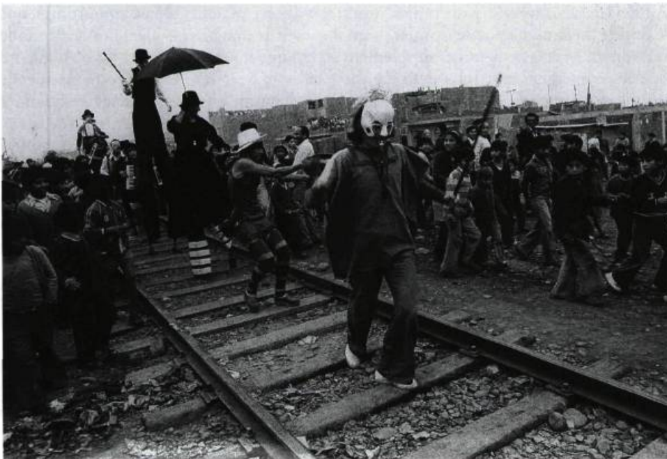
L'Odin Teatret dans une parade à Lima (au Pérou). Organisation et improvisation du comédien du théâtre de rue.

Donc, la notion d'énergie est orientale?