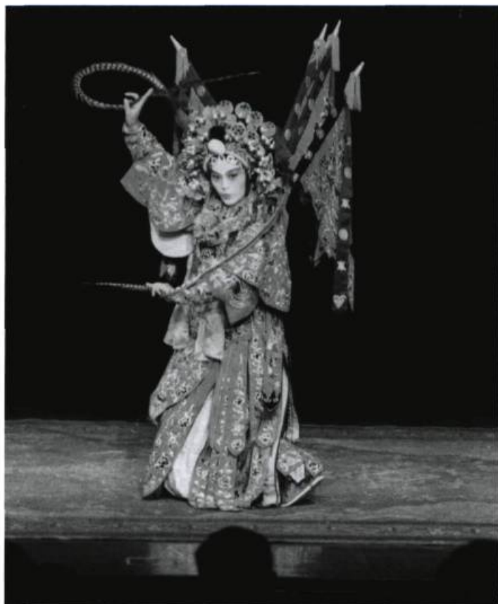
Le travail d'une actrice de l'Opéra de Pékin.

Mais tout cela ne constitue pas la voie royale. Je crois que dans les institutions qui n'ont pas de véritables problèmes de survie, il faudrait travailler surtout à des productions qui permettent la formation du comédien plutôt qu'à celles qui ne visent que le produit théâtral. Certaines productions pauvres, sans scénographie, sans effets de lumière ni musique, seraient utiles pour voir ce qui se passe vraiment sur le plan de la structure de base du théâtre : créer des rapports, un véritable ensemble d'acteurs, une vraie entité théâtrale qui vise au futur. ♦