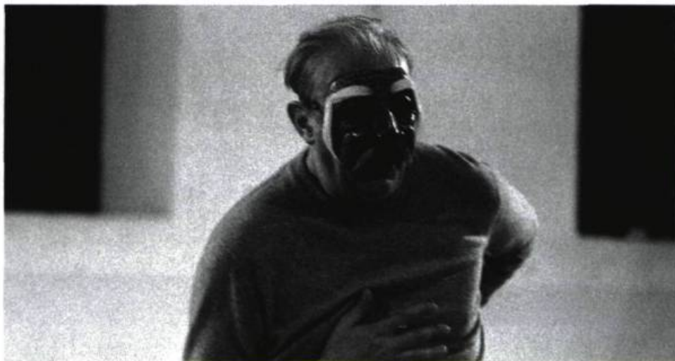
Dario Fo portant un masque balinais pendant une démonstration de travail, à l'ISTA de Volterra (Italie, 1980).

jusqu'au XVIII e siècle, était un divertissement pour le public et, pour les comédiens, une technique qui relevait de la transmission orale. Ce n'est qu'aujourd'hui que le théâtre est considéré comme de la «culture» et produit des «vestiges» écrits. Donc, il n'est resté aucun vrai témoignage de ces déplacements, mises à part les nouvelles de leur avènement. Cependant, cette Route de la Soie des comédiens existe et traverse toutes les cultures : chrétienne, islamique, hindouiste, chinoise et même japonaise, c'est-à-dire jusqu'en Extrême-Orient.