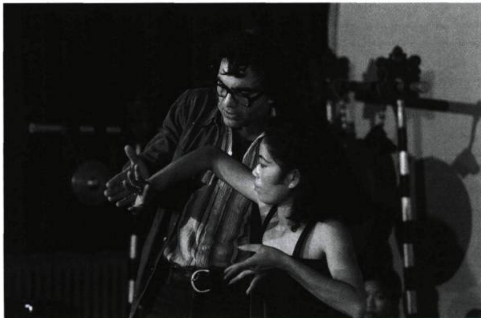
Eugenio Barba à l'ISTA, pendant une démonstration avec une danseuse balinaise.