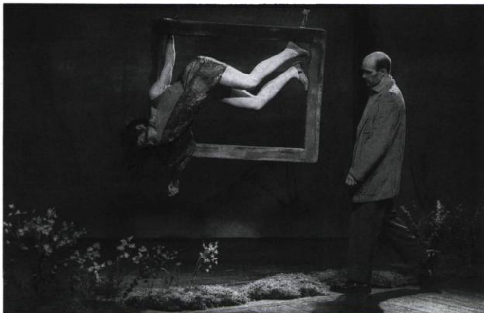
Peau, chair et os : «la femme est jusqu'au-dessus des genoux dans le néant, amputée par le cadre, ou bien surgit-elle du sol comme l'homme sort de la maison et y disparaît-elle comme l'homme dans la maison, jusqu'à ce que s'ensuive ce mouvement continu qui fait sortir du cadre, le vol, la propulsion [...]».