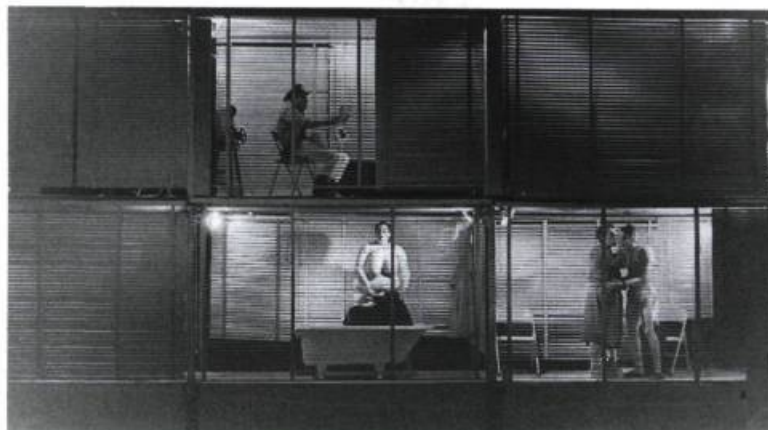
Pain blanc : «ballet déchaîné au centre, cases symétriques au fond». «Le sectionnement en cadres [...] accusait le fractionnement social que dénonçait le spectacle.»