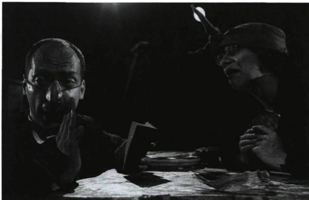
Postales argentinas , un spectacle de Ricardo Bartís qui s'est imposé au cours des trois dernières années.

tionale, l'amour de la sainte mère et de la femme qui inspire l'amour. Les situations sont tendues : on propose que le bandonéon intervienne comme une voix de plus, peut-être celle de la ville mythique et disparue, Buenos Aires. On doit inonder l'ensemble d'une lumière ocre : tout se débattrait dans un bourbier «couleur lion», comme un poète de l'histoire littéraire, maintenant inutile, a déjà qualifié le Río de la Plata.