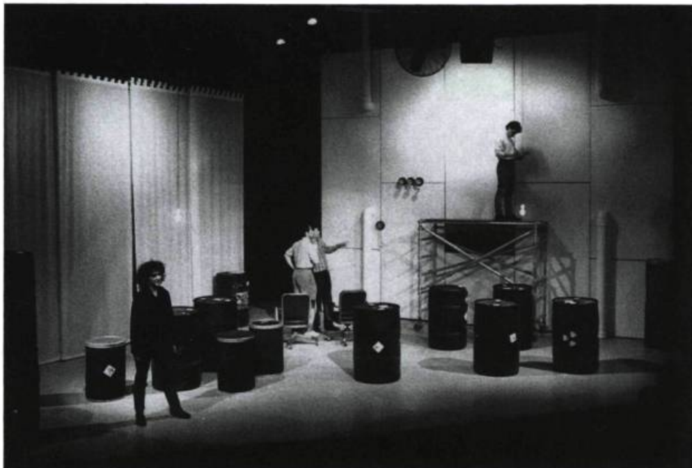
«Imago (dont le directeur artistique est Andres Hausmann) adopte une approche concertée de la création, en faisant travailler des acteurs anglophones et francophones sur des thèmes d'intérêt local ou étranger.» At Work in the Fields of the Bomb , présentée en avril 1990.