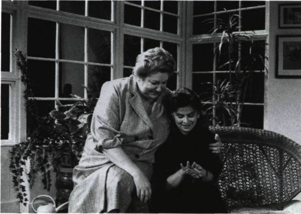
Aurélie, ma sœur de Marie Laberge : un drame psychologique qui traite des rapports familiaux «sur un mode singulièrement cru».

sont nombreuses; les structures, répétitives. Souvent, on nous fait entendre la voix de l'auteur en pleine création 10 , ou encore les didascalies sont littéralement incluses dans le texte à dire. Tous ces procédés, en plus de souligner continuellement l'acte même de créer, sont singulièrement propices à l'ironie. Les discours se doublent ainsi continuellement de commentaires. On peut imaginer comment ces innovations, par rapport à une écriture traditionnelle, modifient beaucoup le rapport du texte à la scène, celle-ci ne pouvant plus se contenter d'«illustrer» celui-là.