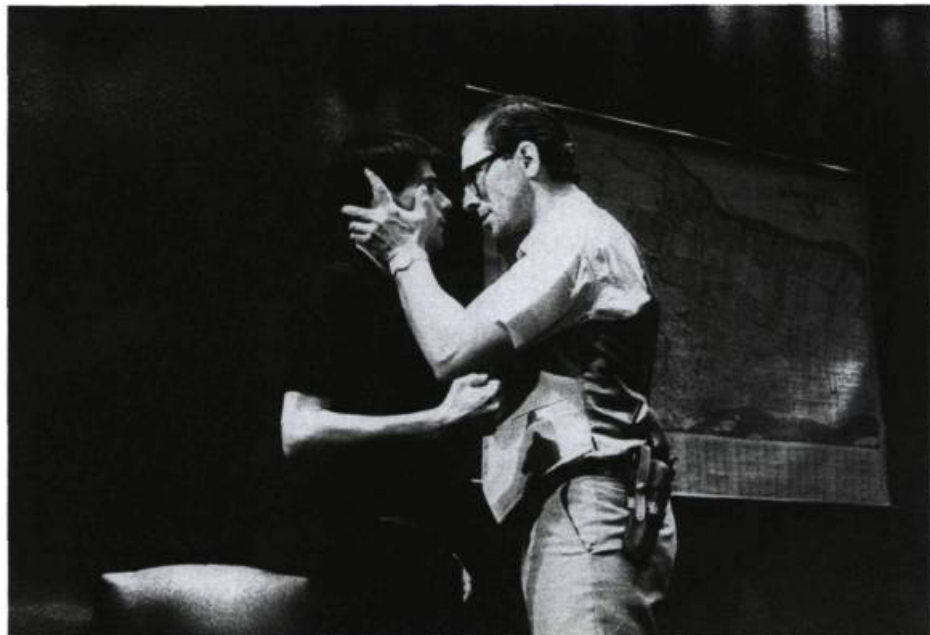
Being at home with Claude : «la pièce est suffisamment bien écrite pour que, dans dix ans, elle soit considérée comme une pièce de répertoire».

une société donnée. Toutefois, il reste que certains textes dramatiques, une fois créés, ne font jamais l'objet de reprises. Par quel phénomène une pièce est-elle retenue dans le répertoire que l'on joue, alors qu'une autre ne l'est pas?