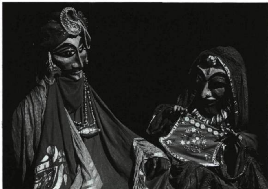
Le Sutradhar Puppet Theater de l'Inde : «... ces masques géants et hiératiques, portés par les comédiens».

J'ai eu la chance de commencer ma semaine de festivalière avec Autumn Portrait d'Eric Bass. Spectacle classique de facture et de manipulation, ai-je noté sur les premiers feuillets de mon carnet. Des contes choisis qui nous parviennent des temps immémoriaux et qui sont offerts avec une lenteur maîtrisée du rythme (et de la vie), avec un dépouillement extrême de l'image et des mélodies-méloées. Six contes, placés sous le signe du temps et du sablier : du temps qui passe, de celui qui a été vécu, de celui qui nous marque, qui nous enveloppe, parce qu'il vient de si loin... ou de si près. Écrivain philosophe, Bass ne craint pas de montrer les dimensions spirituelles de l'être humain, spiritualité qu'il place bien en évidence dans ses manifestations culturelles, historiques et légendaires, traditionnelles tout autant que mythologiques. Manipulateur d'une finesse, d'une attention extraordinaires, le marionnettiste est officiant. Eric Bass m'a envoûtée par ce spectacle où j'ai constaté à quel point l'artiste peut être conscient de son art, de son métier et de sa responsabilité en tant que penseur qui se penche sur la vie et sur l'éternité. J'ai cru à l'existence de ses personnages et j'ai été impressionnée par la densité de sa réflexion de créateur.