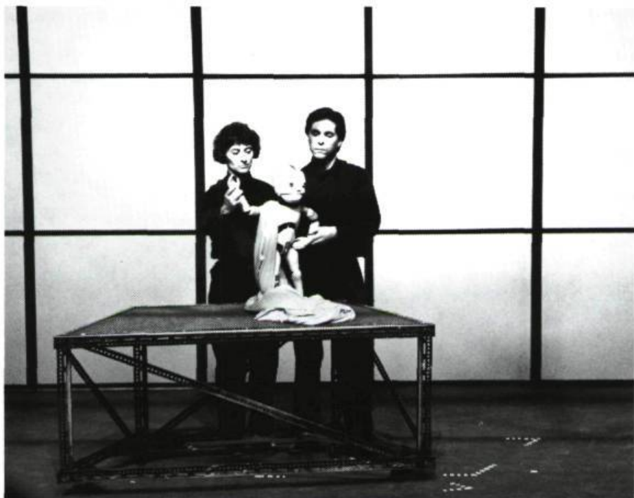
« Impertinences du Théâtre de l'Avant-Pays propose la création d'un monde futuriste mais étrangement familier.»

Sur le mode expérimental, Impertinence du Théâtre de l'Avant-Pays, propose la création d'un monde futuriste mais étrangement familier. La trajectoire (volontaire) et la motivation des personnages (la puissance) sont aussi étrangement familières. La manière de les montrer est ici marquée d'orientalisme par une scénographie toute en lignes et en écrans, des éclairages verticaux qui jouent sur la dureté et sur les émotions, et des projections de lignes et de points de fuite. Le corps identique des marionnettes est articulé mais désarticulé, plastique et métallisé, morcelé. Le corps est comme étranger à lui-même et... l'âme est inquiète. Impertinences est le résultat d'une recherche sur la marionnette et sa manipulation, recherche qui a induit le contenu et le style. Voilà qui est intéressant: la marionnette ne répond pas à un texte, n'illustre pas un conte classique; le texte et le style répondent à l'appel de la marionnette qui existe avant eux. Ur-marionnette 8 .