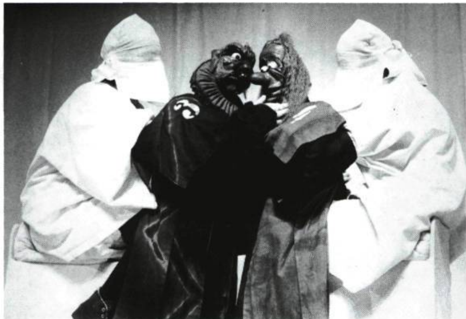
Le Hamlet yougoslave, en quarante-cinq minutes et sur roulettes, ajoutait certes au rythme et à la fête.

man australien qui vole au secours des pauvres et des opprimés, dont les femmes et les aborigènes. La statue commémorative qu'on lui érige à la fin le montre donc flanqué d'angelots blancs et bruns. Et le trait final est pour nous dévoiler la vraie nature du héros: Superkangourou est une femme qui porte fièrement son petit dans sa poche ventrale. Les propositions sociales de Bradshaw sont claires et elles ont le mérite de l'humour (notons quand même que les aborigènes australiens ont un statut beaucoup plus enviable que nos Amérindiens).