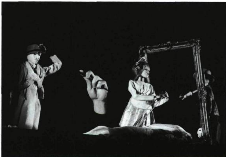
« Ligne de fuite de Roman Paska, d'une écriture inspirée à la fois par le surréalisme et l'absurde.»

où l'on aurait pu entendre les maîtres, leurs disciples et leurs contradicteurs exposer leur conception des choses et leur vision du monde.