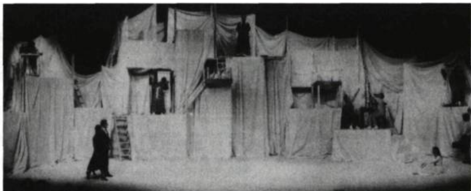
Vessel , de Meredith Monk, présenté à la Schaubühne de Berlin.

lement issus d'un scénario plutôt que d'un texte, et l'on y a souvent renoncé à l'anglais en faveur d'un idiome inventé ou d'une langue archaïque. Swados et Serban ont eu recours au grec antique et au latin dans Fragments of a Trilogy . Le texte d' Einstein est presque entièrement constitué de notes de solfège (do, ré, mi, fa, etc.). Glass a composé Satyagraha à partir d'un texte en sanscrit, et Akhnaten est chanté en akkadien, en égyptien et en hébreu. La dissociation du narratif et des vocables prononcés accentue la nature opératique de ces oeuvres, et n'est pas sans rappeler l' Oedipe-Roi de Stravinsky (dont le texte est en latin afin de créer un effet de distance) ou les livrets de Gertrude Stein.