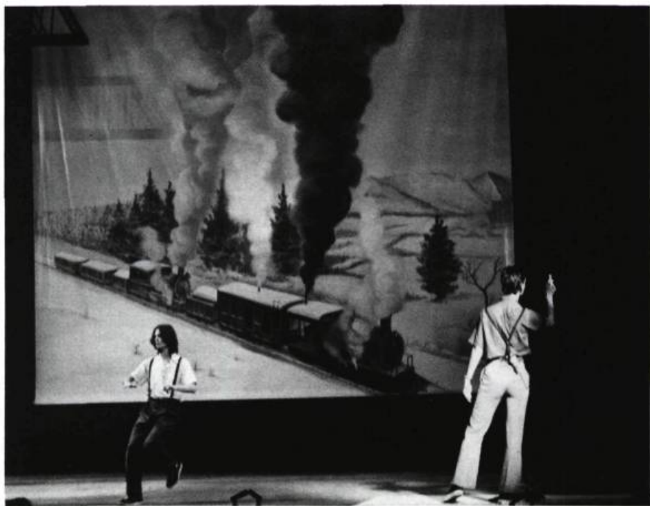
Einstein on the Beach , « le nouvel opéra le plus important de la décennie. »

Peter Sellars, metteur en scène maintenant rattaché au Kennedy Center, déclarait récemment au cours d'une interview: « Dans l'histoire du théâtre occidental, il y a eu trois moments déterminants: le théâtre grec, le théâtre élisabéthain et la comédie musicale américaine. Dans les trois formes, on trouve cette espèce de puissance à l'état brut qui rejoint toutes les couches de la société et amène une nation à se rêver ouvertement. » Quelque excessive que soit l'affirmation de Sellars, il est vrai que la nation américaine s'est «rêvée» à travers des oeuvres musicales de tous genres: comédies musicales de Broadway, de Hollywood, comédies musicales de groupes ethniques, opéras — tant traditionnels qu'expérimentaux —, et même à travers les émissions diffusées par M.T.V. Et, assurément, plusieurs des nouvelles oeuvres de théâtre musical les plus ambitieuses (que l'on songe au CIVIL warS de Robert