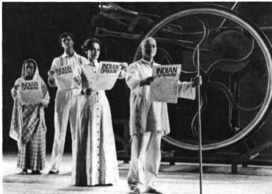
Satyagraha , de Philip Glass.

Exception faite des scripts détaillés de Richard Foreman, ces spectacles sont généra-