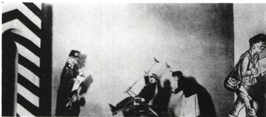
«Une des « mises en signes » les plus surprenantes»: les Aventures du brave soldat Schwejk d'après le roman de Hašek. Adaptation: collectif Piscator. Mise en scène: Erwin Piscator. Décors: George Grozz. Création le 23 janvier 1928 à la Piscator-Bühne, Berlin.

tiatique devant un public russe anti-idéaliste? Comment canaliser les réactions d'un public de 45 000 personnes face à une reconstitution historique impliquant un millier d'interprètes (rarement professionnels) 3 ? Autant de gageures que seuls permettaient l'audace, le travail et la foi (théâtrale et idéologique).