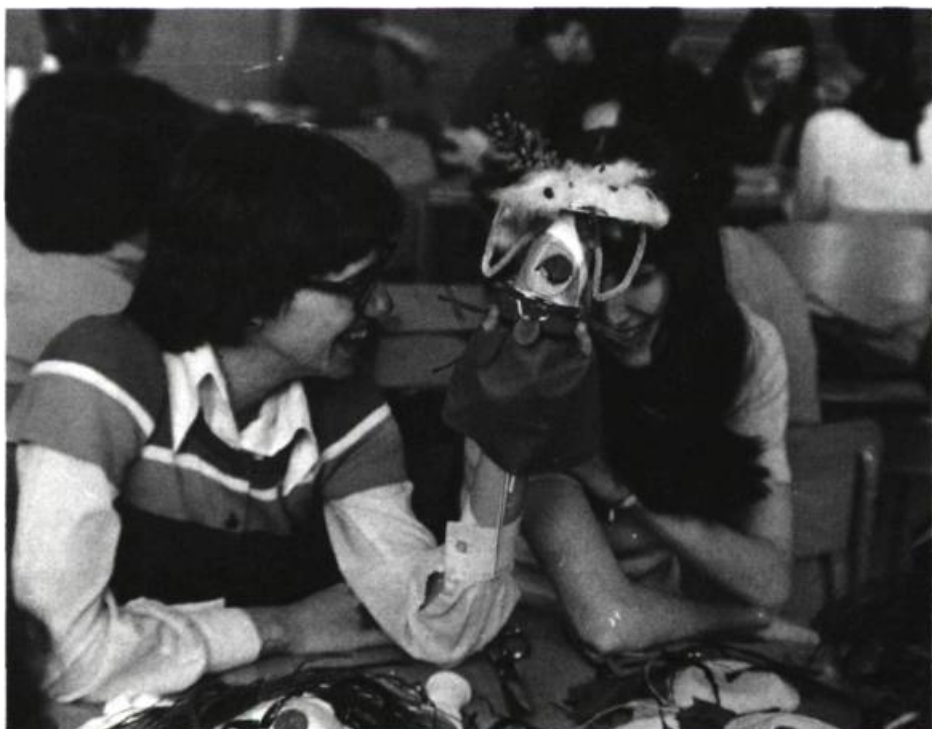
Atelier sur la marionnette animé par le Théâtre de l'Oeil.

L'Union des écrivains québécois entreprend la publication du Dictionnaire des écrivains contemporains qui inclura tous les écrivains ayant publié au moins deux volumes en littérature (poésie, roman, théâtre, conte, littérature de jeunesse, etc.) au cours des dix dernières années. Tout écrivain répondant à ces critères est prié de contacter l'Union des écrivains québécois: 964, rue Cherrier, Montréal, H2L 1H7; tél.: 526-6653.