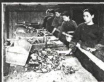
ÉTUDES HISTORIQUES DU QUÉBEC

commun le désir de faire advenir ce qui veut tant naître depuis l'origine de la conscience féministe, c'est-à-dire l'existence d'une culture féminine que certaines et certains pressentent mais dont on ne voit pas encore l'expression dans la réalité et encore moins dans son miroir, le théâtre.