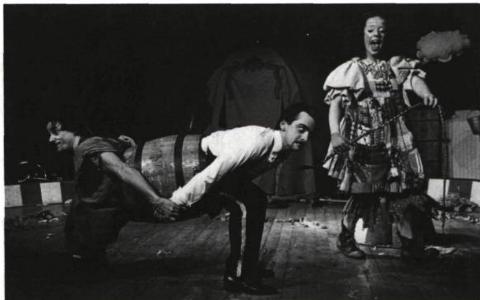
Chatouille et Chocolat à la besogne , 1974.