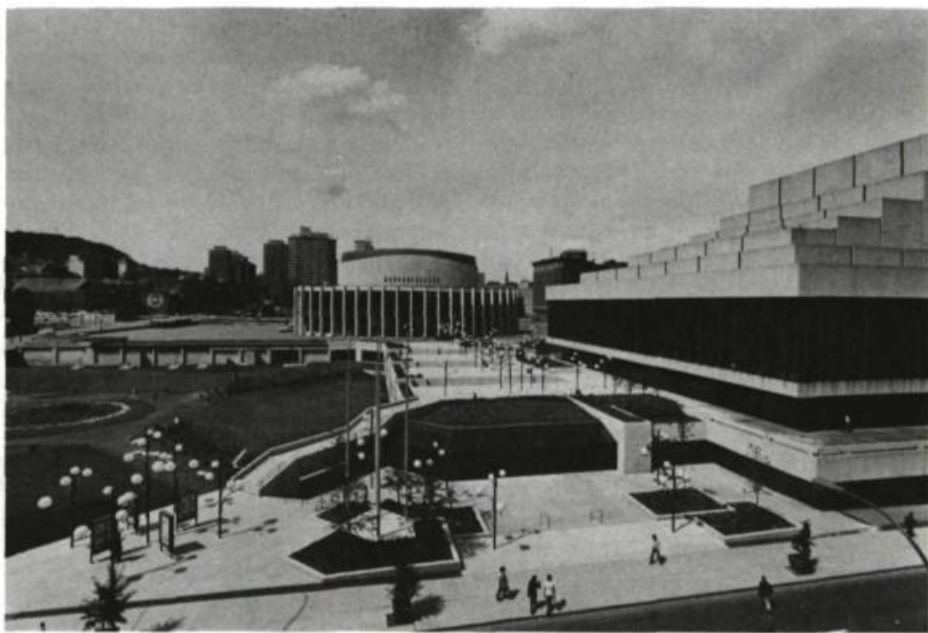
Le complexe de la Place des Arts à Montréal.

Alors! Comment la définir cette «Culture Populaire»? Sur ce point, le Livre blanc dévoile ses «blancs». La Place des Arts, maintes fois mentionnée dans le document, peut difficilement répondre à cette épineuse question puisque le Livre blanc l'avoue lui-même: «À Montréal, plus des 3/4 des ouvriers et employés n'ont jamais fréquenté la Place des Arts». Le document reconnaît l'adéquation entre l'exploitation