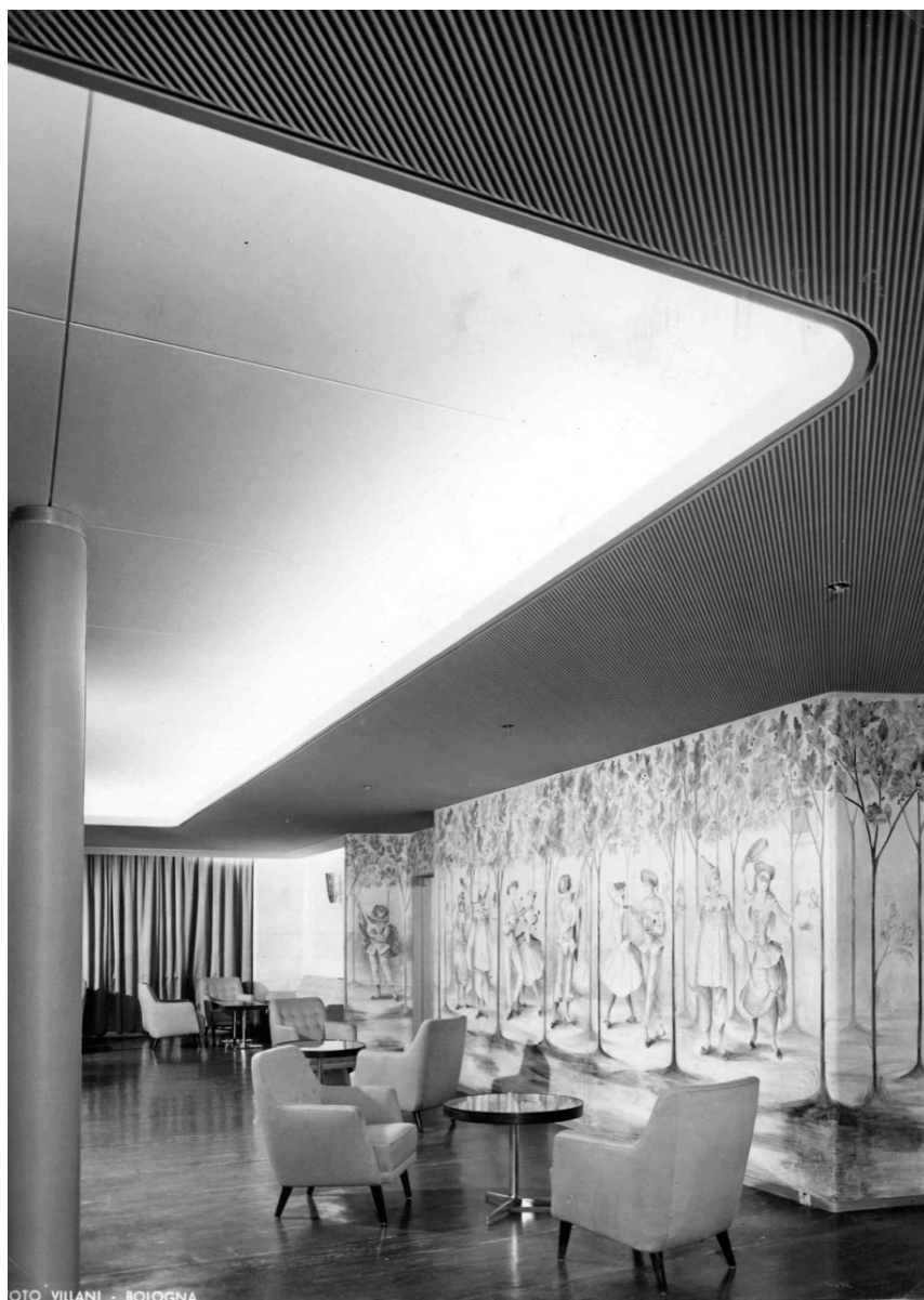
4. Matteo Longoni, Sala delle feste di classe cabina , Felicità Frai, Allegoria d'Autunno , t/n Andrea Doria , 1951 (Archivio Matteo Longoni, Milano).