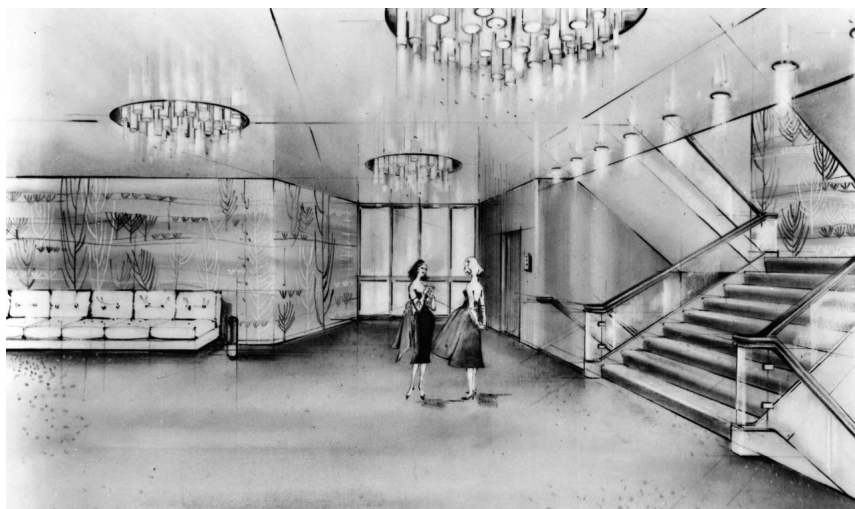
2. Matteo Longoni, Schizzo per una hall di prima classe di un transatlantico , s.d. (Archivio Matteo Longoni, Milano).