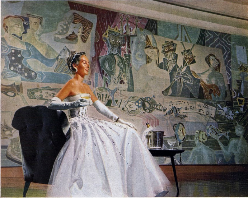
Mural by world-famous Pietro Zaffi: "Neptune's Banquet" in the Grand Ballroom