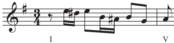
Exemple 2. Exemples de motifs créés par l'apprenant à partir du même concept fondamental