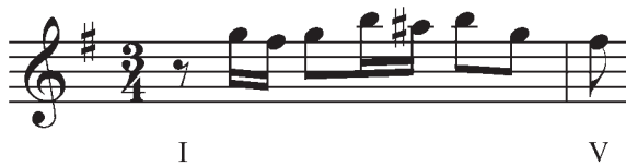
Exemple 1. Exemple de motif à mémoriser avec broderie inférieure chromatique

nouveaux motifs en temps réel, en respectant toujours le concept fondamental en apprentissage.