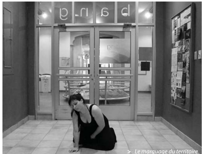
> Le marquage du territoire

> Caroline Fillion, actions furtives, centre d'art actuel Bang, 2014, durée 6 h. Aucun public n'est venu, car il n'était pas invité.