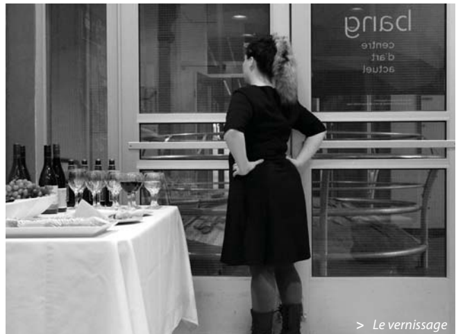
> Le vernissage

Ici, l'organisme diffuseur se voit contraint à ne pas diffuser – inversant, de fait, son essence. L'artiste se retrouve donc en ce lieu où sa qualification d'artiste devient une ambiguïté. L'autocensure de sa proposition performative, par l'absence d'artiste, de public ou, encore, la représentation du refus, propose une critique de la visibilité de l'artiste. En outre, l'émulation des spécificités de la logique des diffuseurs, en l'occurrence l'instant du vernissage ou de l'exposition,