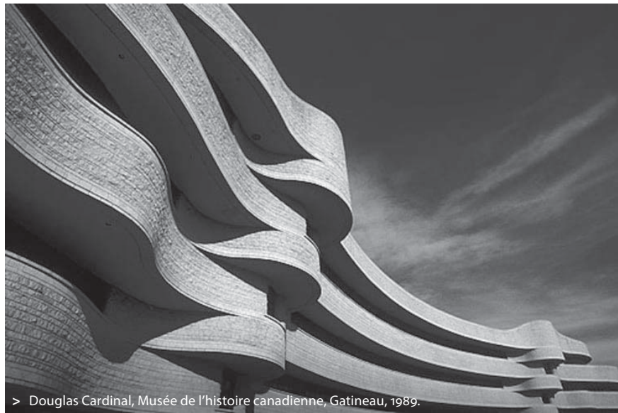
> Douglas Cardinal, Musée de l'histoire canadienne, Gatineau, 1989.