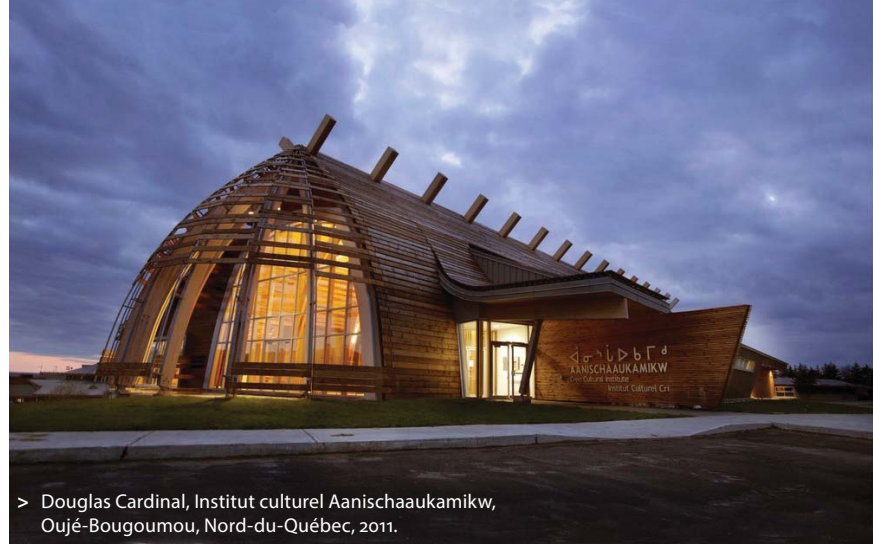
> Douglas Cardinal, Institut culturel Aanschaaukamikw, Oujé-Bougoumou, Nord-du-Québec, 2011.