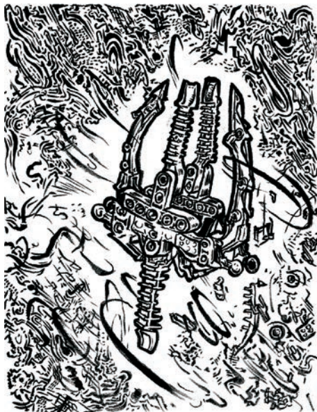
> FlexiB, Îlot synaptique 3 , encre de Chine sur papier Canson, 2012.

L'œuvre de FlexiB, quant à elle, nous entraîne dans l'un des thèmes privilégiés de la science-fiction : la relation homme-machine. En s'inspirant du roman Les robots d'Isaac Asimov, l'artiste explique avoir voulu traduire la psyché d'une machine, entrer dans une « coquille vide », dans une pensée « désincarnée ». Par référence à la bande dessinée, média privilégié de la science-fiction, FlexiB présente un ensemble de dessins géométriques représentant l'évolution d'une intelligence artificielle vers la conscience humaine. L'esprit du robot est appréhendé comme scène narrative complexe, dense de filages, de chiffres, de boutons, etc., comme espace intérieur qui s'éveille aux données émotionnelles. Il emprunte de la sorte à la fois la vision technique du biologiste Asimov et les questions éthiques qui émanent du roman. En effet, la science-