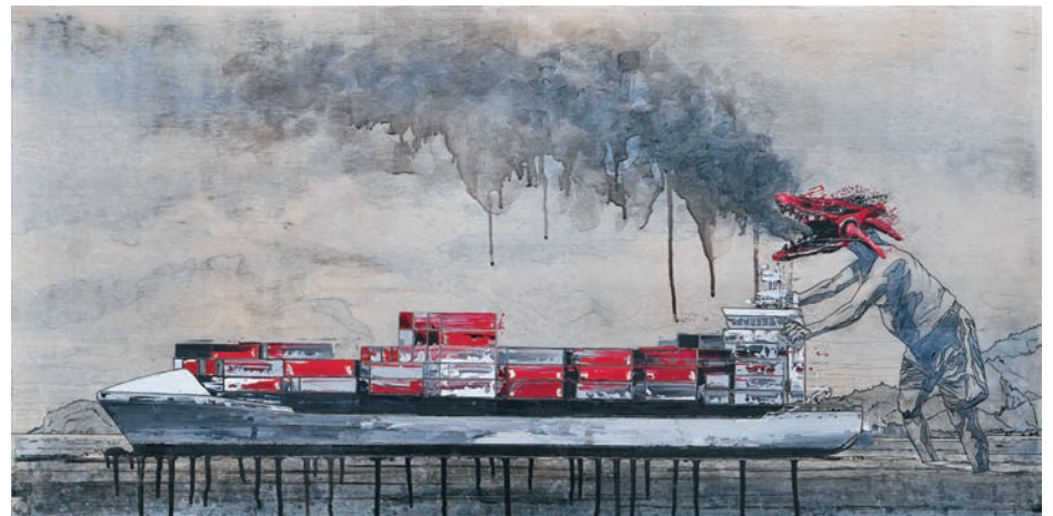
> Martin Bureau, From China with Love 11 , graphite, acrylique, huile et feuille d'aluminium sur bois, 2010.