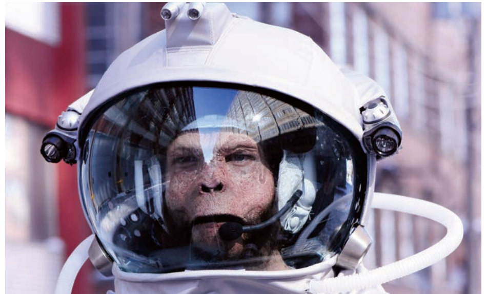
> Patrick Bernatchez, image tirée de Pluton , pellicule 35 mm transférée sur support numérique, 57 secondes, 2008.

Cette vision chaotique de l'orientation de l'histoire humaine, de ses déroutes et de son déclin, est également abordée par Martin Bureau. Dans cette dernière œuvre, tirée de la série China with Love , le peintre évoque le thème de la surconsommation par la représentation d'un cargo de marchandises poussé par une créature hybride, mi-homme, mi-dragon. Tout en se référant à la mythologie chinoise, dont l'état est très productif en ce qui a trait à la transformation des matières premières, cette figure spectrale évoque aussi le dragon de l'Apocalypse. L'artiste