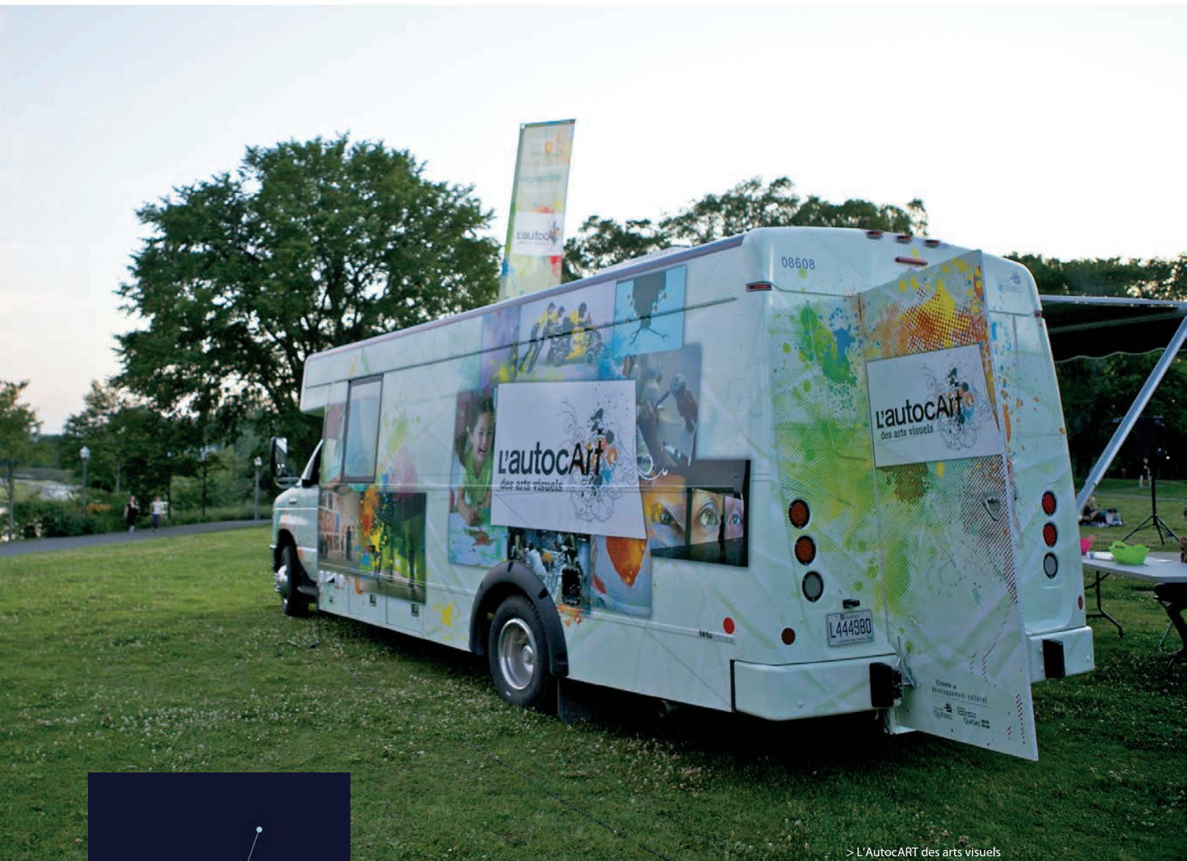
> L'AutocART des arts visuels