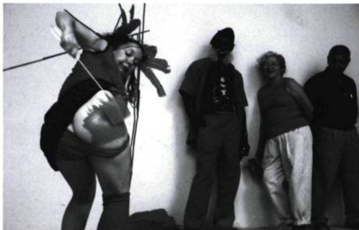
JULIE ANDRÉE T. / ROUGE

Cet échange entre les villes de Québec et La Habana poursuivait deux autres échanges similaires réalisés par Le Lieu, centre en art actuel, soit Mexico (2001) et Cracovie (2004).