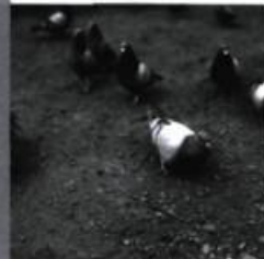
SYLVIE LAROUCHE / IMAGES DU QUOTIDIEN