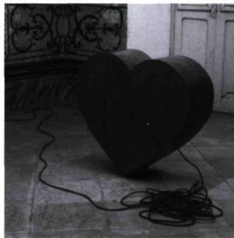
MATHIEU VALADE / ROC

En dépit de la très grande distance séparant une ville canadienne d'une ville cubaine, de la différence de langue, de systèmes politique, économique et social, et de climats opposés, des artistes des deux villes semblent avoir plusieurs choses en commun, ce qui nous amène à réfléchir sur les possibilités incroyables de l'art en tant que moyen, attitude et geste capables de mettre en relation, d'intégrer des êtres humains au-delà de leurs différences et de contribuer à une meilleure compréhension de celles-ci.