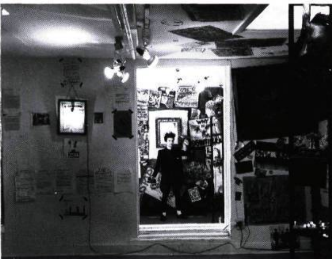
Le Salon d'or, Monty CANTSIN. Photo : Eva QUINTAS