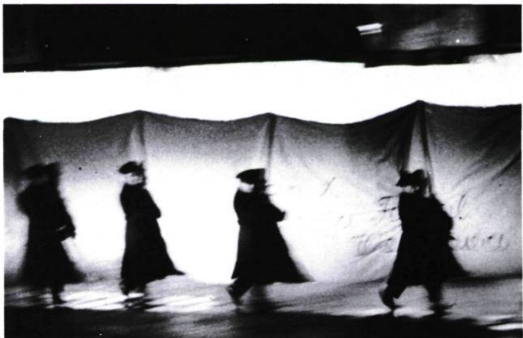
Tadeusz KANTOR, Happening La Lettre, Varsovie, 1967.