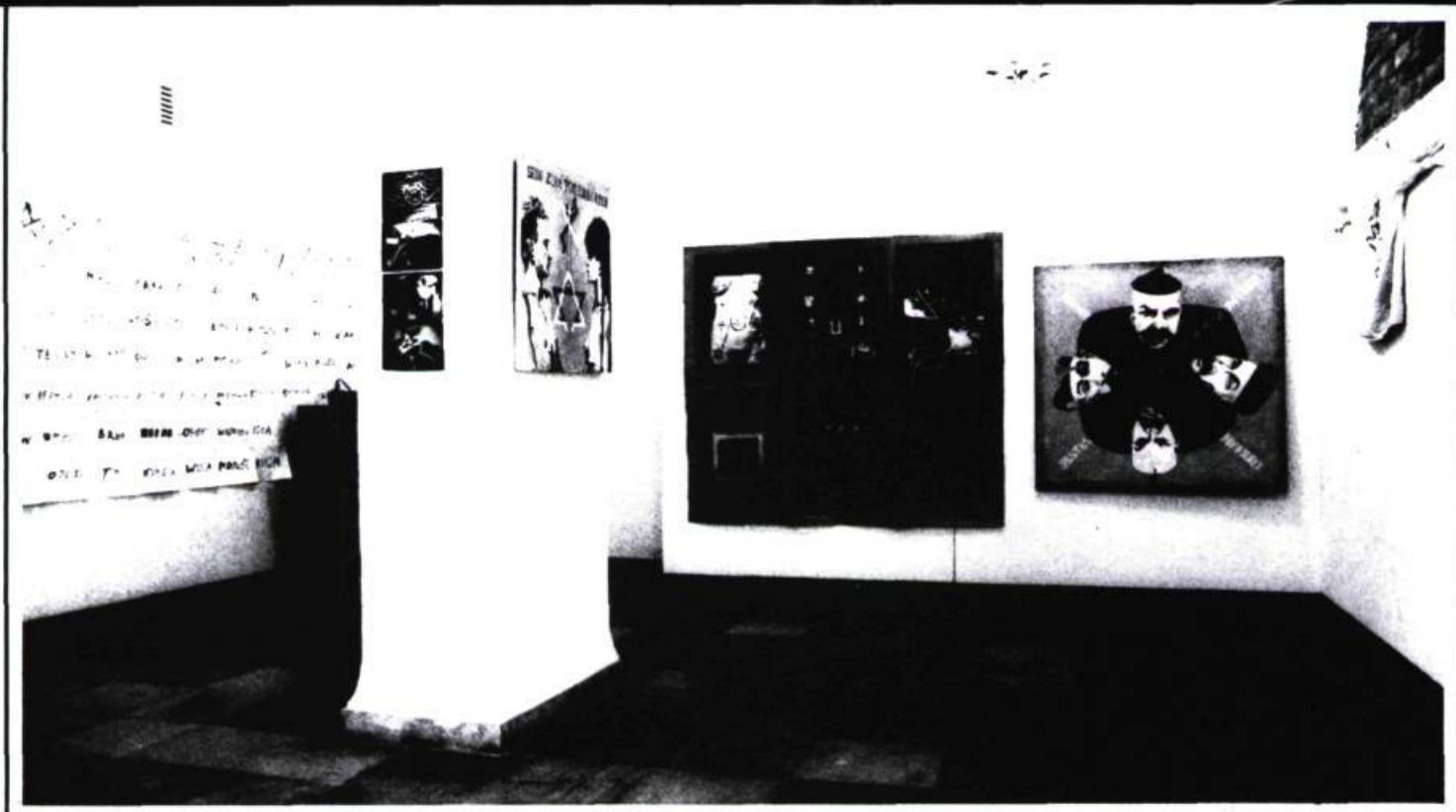
ZAKONSERWOWANE (PRESERVES), MAŁA GALERIA, (1984) • OUVERTURE-OPENING COLLECTION EXHIBITION, MAŁA GALERIA, 10TH YEAR ANNIVERSARY • JERZY TRUSZKOWSKI POZEGNANIE EUROPY (THE FAREWELL OF EUROPE), MAREK CRYGIEL, MAŁA GALERIA, (1988), VIDEO SHOW, PERFORMANCE AND EXHIBITION.