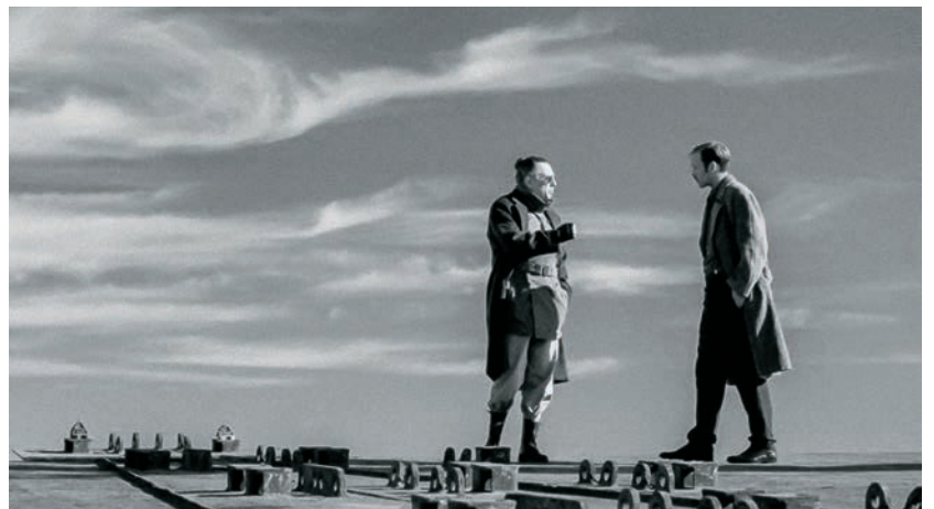
9 doigts (2017)

Le cinéma est un peu sorcier, au fond. Il relève de l'alchimie. Ce qui me fascine dans l'alchimie, c'est qu'il s'agit d'une forme de