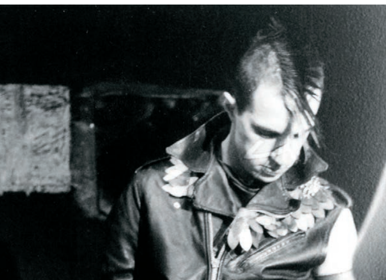
[1-2] Docteur Chance (1997) et [3] L'affaire des divisions Morituri (1984)

métaphysique hypermatérialiste. À cet égard, il me semble que le cinéma marque une sorte de résurgence des temps anciens. Ce culte de la lumière qui traverse son histoire nous ramène à Mazdâ