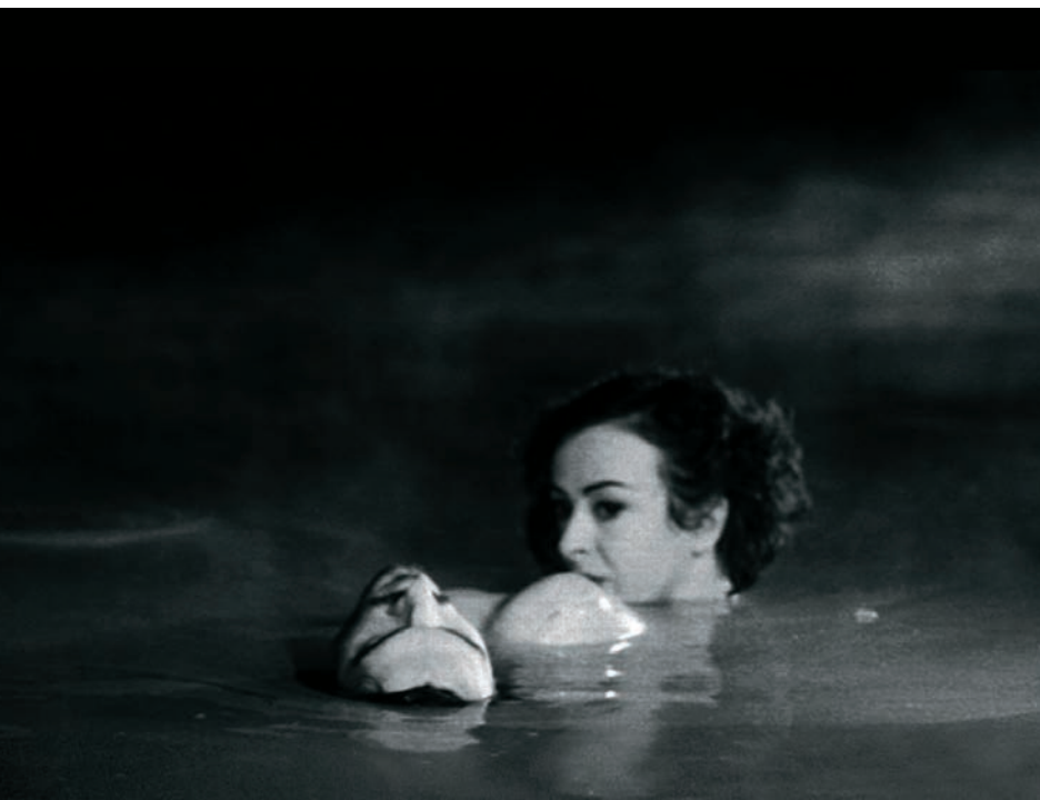
Dharma Guns (2011)

J'ai toujours dit de mes autres films qu'il s'agissait de voyages au pays des morts et peut-être qu'ici, en effet, les personnages sont déjà morts sans le savoir. On me dit toujours que mes films sont « apocalyptiques » ou « postapocalyptiques », mais ce n'est pas complètement conscient non plus. Quand j'écris, j'ai certainement une rage