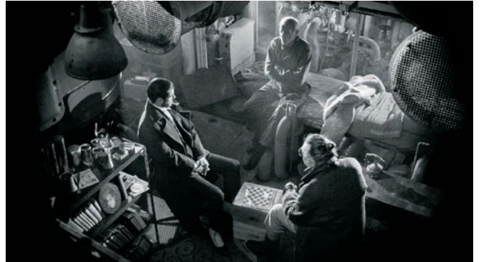
9 doigts (2017)

lorsqu'ils se rendaient en Amérique, puis au Cap-Vert lorsqu'ils revenaient. Dans ma jeunesse, j'ai été marqué par l'alchimie, par cette idée qu'il existe un centre du monde – et pour moi, les Açores représentent un peu ce centre du monde. L'Atlantique est un peu la Méditerranée moderne.