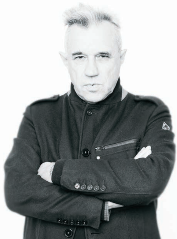
Portrait de F.J. Ossang par Ulysse del Drago (FNC)

Le film se déroule dans un univers irradié et j'ai l'impression que l'image argentique crée un rempart. Elle protège