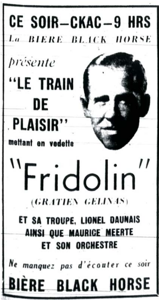
La Presse (14 septembre 1938): 24 (BAnQ)