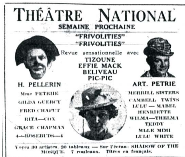
La Presse (6 septembre 1930): 73 (BAnQ)