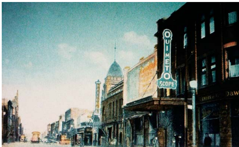
Philippe Du Berger – Montréal vers 1910, rue Sainte-Catherine Est, depuis rue Montcalm

M ontréal, mercredi 14 septembre 1938, 20h. Une foule compacte se masse rue Saint-Denis devant le cinéma du même nom. Plus de 6000 personnes seront bientôt refoulées par le personnel de la salle, qui est déjà pleine à craquer en dépit de ses 2400 sièges. Elles se consolent toutefois en se disant qu'elles pourront au moins suivre le spectacle de chez elles. Car, ce qui fait courir les Montréalais en cette soirée de septembre, ce n'est pas la dernière vue de Danielle Darrieux, Marcel Pagnol ou Fernandel, mais une nouvelle émission radiodiffusée en direct du Théâtre St-Denis par un jeune artiste canadien, Gratien Gélinas. Auteur et interprète principal d'une revue ayant rencontré un succès sans précédent au Monument-National l'hiver précédent, ce dernier vient de se faire offrir une émission radiophonique hebdomadaire commanditée par la brasserie Dawes. Intitulée Le train de plaisir , cette émission représente pour l'époque un bel exemple de convergence médiatique, puisqu'elle est produite sur la scène d'une salle de cinéma et radiodiffusée par une station radiophonique, CKAC, créée par le journal La Presse .