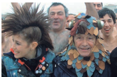
Les Mille et une nuits (2015)

cette histoire ne les tienne plus en haleine. Miguel Gomes s'est mué en Shéhérazade, il l'a peut-être toujours été. Fin du prologue. Le film peut commencer... et Les Mille et une nuits réenchanter notre monde.