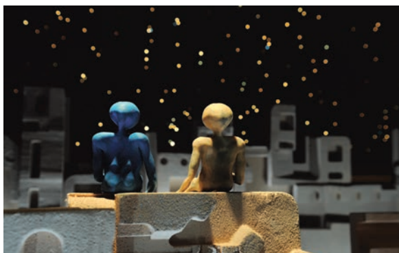
Horse (2013) Shen Jie / Jasmine (2013) Alain Ughetto