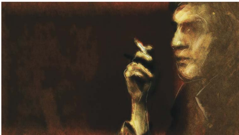
LES JOURNAUX DE LIPSETT (2010)

© 2010 Office national du film du Canada. Tous droits réservés.