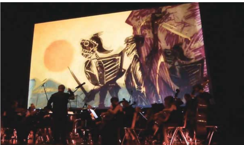
GLORIA VICTORIA, présenté en performance à Poznan, en 2013.

Oui, c'est le cas avec moi. L'animation a une puissance thérapeutique et j'en suis un bel exemple. Lorsque j'étais au Musée de la civilisation à Québec, des gens passaient autour de moi. Une femme est venue accompagnée de ses enfants, une femme de 70, 80 ans qui a eu une sclérose multipliée. C'était une ancienne enseignante en linguistique et une femme très intelligente mais là, elle est devenue un légume à cause de la maladie. Elle n'avait plus aucune réaction, aucun mouvement des yeux. Elle regardait des films d'animation qu'on projetait et là, elle a réagi. Et ses enfants m'ont dit: c'est la première fois depuis trois ans qu'elle a eu une réaction. Ils avaient essayé de la mettre devant la télévision. mais ça n'avait pas marché. Ils se sont dit que, peut-être, ils devraient lui montrer plus de films d'animation. C'est de là que l'idée est venue: l'animation aide. Elle n'est pas thérapeutique que pour les cinéastes mais aussi pour le public. Évidemment, ce n'est pas médicalement prouvé et peut-être que je me trompe et que j'idéalise trop ce que j'ai vu.