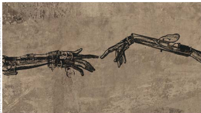
TOWER BAWHER (2006) et DRUX FLUX (2008)