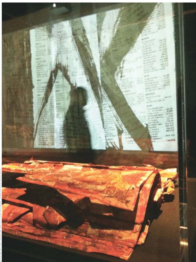
3 e PAGE APRÈS LE SOLEIL (2014)

C'est une question intéressante. Tu sais à cette époque, on était en pleine guerre froide et l'animation a servi aux artistes du bloc de l'Est pour s'exprimer, car on censurait beaucoup dans ces pays-là, et ils ont fait des films puissants avec des métaphores, des symboles. Aujourd'hui, on considère souvent que c'est un défaut de faire ça. Les politiciens dans ce temps-là regardaient le cinéma d'animation comme quelque chose de peu important, destiné aux enfants. Ils ne