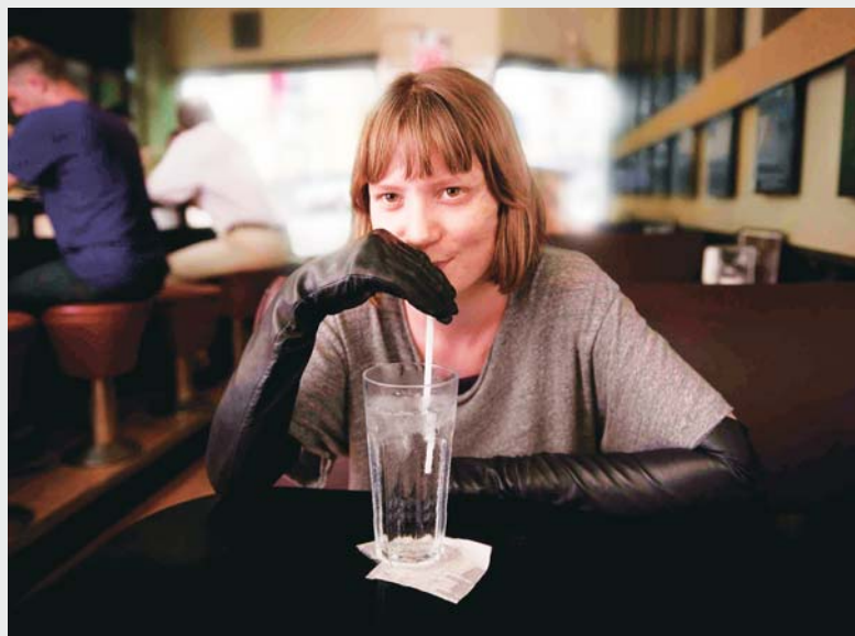
MAPS TO THE STARS de David Cronenberg

Ainsi, Adieu au langage de Jean-Luc Godard est LE film de l'année. Ce cinéaste n'a jamais hésité à se confronter aux multiples transformations du cinématographe, et le voici qui prend à bras-le-corps la 3D, procédé accusé d'être artificiel et infantilisant. Mais pas pour Godard, toujours à l'affût des techniques dans l'articulation d'un cinéma impur qui doit révéler le monde. Cet « essai d'investigation cinématographique » est un foudroyant commentaire sur l'espèce humaine. Plus mélancolique que jamais, Godard y dit adieu