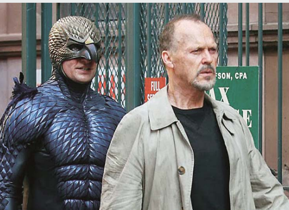
BIRDMAN d'Alejandro Gonzales Iñárritu

Faire un bilan de fin d'année, c'est forcément faire des choix. Écrémer. Ne retenir que les films qui ont émergé, chacun à leur façon, au milieu d'un océan toujours plus peuplé (surpeuplé même) d'images et d'idées. Pourquoi ceux-là, alors ?