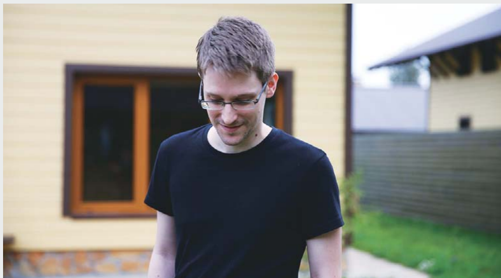
CITIZENFOUR de Laura Poitras