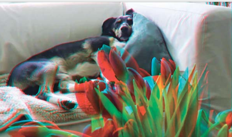
ADIEU AU LANGAGE de Jean-Luc Godard

Autre film sans faux-fuyants, Atlas d'Antoine d'Agata, dont il est amplement question à la p.15.