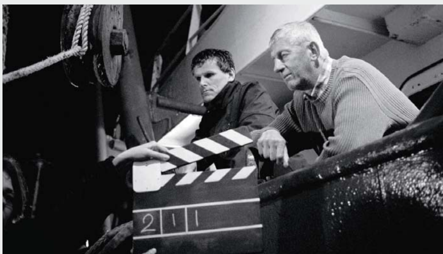
EPISODE TO THE SEA de Siebren de Haan et Lonnie van Brummelen

Dans un registre plus modeste, mais non moins précieux, l'étonnant Episode of the Sea des Néerlandais Siebren de Haan et Lonnie van Brummelen, découvert aux Rencontres internationales du documentaire de Montréal, pose lui aussi la question des outils du documentaire. Filmé en noir et blanc, avec une Arriflex 35 mm de 1980, le film propose un parallèle entre le travail des cinéastes et celui des pêcheurs, soulignant le côté obsolète des outils traditionnels que les uns et les autres s'entêtent à utiliser. Au-delà de ce parallèle aussi étonnant qu'audacieux, Episode of the Sea est un authentique documentaire – d'aucuns y ont vu une parenté avec le Man of Aran de Flaherty – qui nous apprend beaucoup de choses sur les difficultés