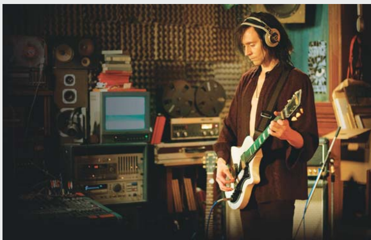
ONLYLOVERS LEFT ALIVE de Jim Jarmusch

L'année aura malgré tout été marquée par quelques grands thèmes, à commencer par cette idée qu'il existe un décalage entre la représentation que l'on offre de soi et la réalité, amplifiée par le régime médiatique contemporain. Cette idée est au cœur du Gone Girl de David Fincher. L'intrigue abracadabrante, empruntée à un roman de Gillian Flynn, sert essentiellement à soutenir et à amplifier les enjeux d'une mise en scène où chacun joue son propre