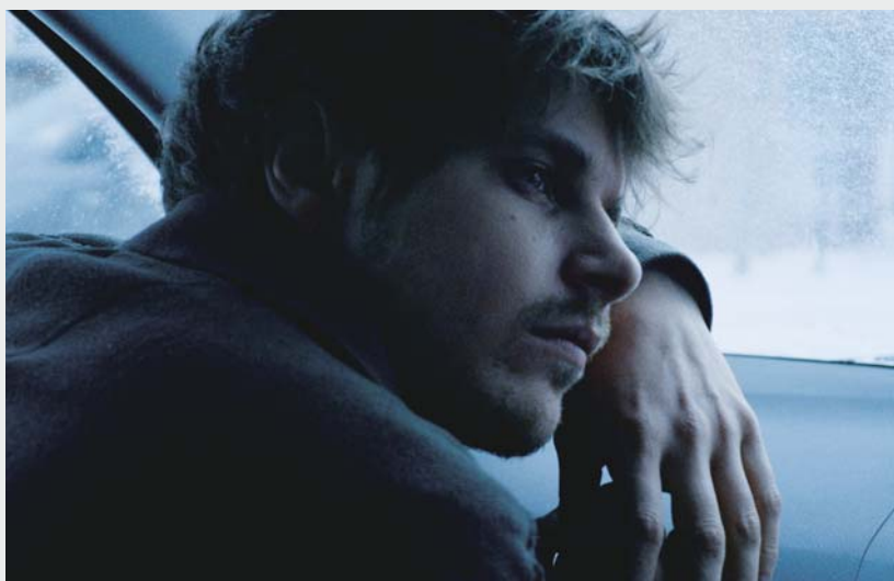
L'AMOUR AU TEMPS DE LA GUERRE CIVILE de Rodrigue Jean

Partir encore et toujours de Godard chez qui, face à la fatigue du monde, le texte et l'image demeurent un champ de possibles à défricher alors qu'il n'y a plus de langage. Comment continuer à dire ce monde devenu illisible, comment (re)donner à voir, comment renouer avec ce qui est perdu et chercher l'embrasement, parfois avec de nouvelles armes : voilà ce qui a, en quelque sorte, guidé nos choix à l'heure des bilans.