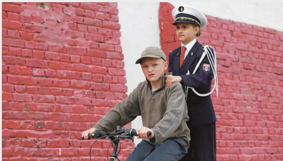
P'TIT QUINQUIN de Bruno Dumont

Ce bilan n'est pas une synthèse de l'année cinéma 2014. Il s'agit plutôt du parcours d'un spectateur hanté par un film qui est revenu le frapper de plein fouet peu de temps avant d'écrire ce texte, s'imposant définitivement comme l'œuvre la plus importante de l'année. Ce film, c'est le P'tit Quinquin de Bruno Dumont. J'ai déjà écrit sur ce film 1 . À l'époque, comme de nombreux critiques, je tentais de rendre compte de mon admiration envers l'originalité du ton et les audaces formelles dont faisait preuve le cinéaste français en s'aventurant pour la première fois dans le domaine de la comédie. Or, il est évident que la démarche de Dumont dans P'tit Quinquin vise à provoquer un vague malaise. Selon Van der Weyden, son improbable gendarme, l'univers du P'tit Quinquin se situe « au cœur du mal ». Mais de quel mal s'agit-il ? Pour paraphraser Marguerite Duras, j'avais bien regardé P'tit Quinquin , mais je n'avais rien vu. J'aurais dû me souvenir d'Agatha dans The Grand Budapest Hotel de Wes Anderson.