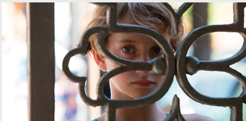
INCOMPRESA d'Asia Argento

Parfois l'actualité occupe l'esprit à tel point qu'on ne peut s'empêcher de (re)penser rétroactivement les films en fonction des événements récents. Cela ne change rien aux œuvres qui nous ont marqués, mais celles-ci se mettent simplement à résonner encore un peu plus qu'elles ne le faisaient, certains aspects surgissant en relief, à un moment où l'on est à la recherche avide de sens et d'idées. Ce ne sont pas forcément les grands films qui constituent un palmarès, mais ceux qui ont touché juste et laissé leur empreinte. Quelques motifs communs s'en dégagent inévitablement, d'une façon inédite selon chaque nouveau contexte. Des motifs qui les font se répondre entre eux, mais répondent surtout à nos chimères.