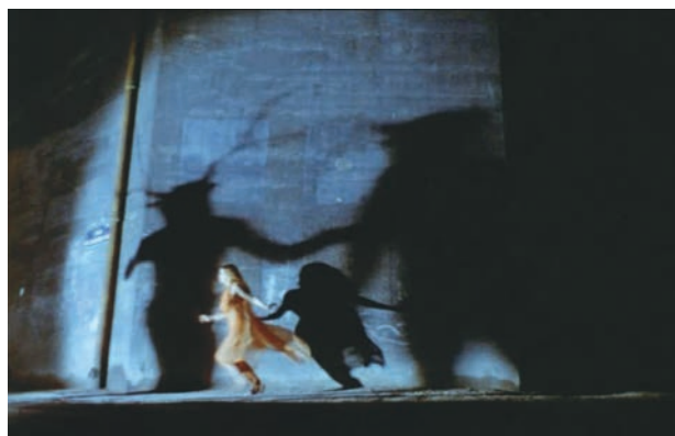
LES VAMPIRES (1915) de Louis Feuillade, LA VAMPIRE NUE (1970) de Jean Rollin

L'OMBRE DE LOUIS FEUILLADE SEMBLE S'ÉTENDRE SUR L'ENSEMBLE DU CINÉMA DE GENRE FRANÇAIS, SON ŒUVRE servant de source d'inspiration intarissable pour tous les cinéastes ayant suivi les pas du metteur en scène de Fantômas . Si violents et subversifs, pour l'époque, que certaines villes françaises en ont interdit la projection, les cinq épisodes de cette première série à succès (1913-1914) préparent le terrain pour Les vampires et pour la flamboyante Irma Vep, criminelle énigmatique dont le maillot de soie noire marquera l'inconscient collectif.