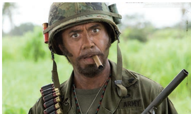
TROPIC THUNDER (2008) de Ben Stiller

Effectivement très drôle, la scène est également exemplaire du travail de Robert Downey Jr. qui, d' Iron Man à Sherlock Holmes , ne cesse de multiplier les niveaux de lecture que l'on peut faire de ses performances, les habitant autant de ses improvisations (il en est fêru) que de sa propre persona (celle d'un acteur combattant, revenu au