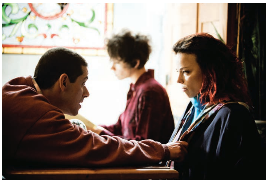
Melvil Poupaud et Suzanne Clément (2012).

La carrière cinématographique de Suzanne Clément, très connue des téléspectateurs québécois depuis Les hauts et les bas de Sophie Paquin, a pris son véritable envol avec Laurence Anyways de Xavier Dolan, qui lui avait déjà donné un beau rôle de professeur empathique, tout de bienveillance, dans son premier film, J'ai tué ma mère . Pour son rôle de Frédérique dans le troisième film de Dolan, elle ne se ménage pas ! Dans cette histoire de passion et d'amour aussi excessive qu'exceptionnelle, elle se donne à fond, comme si elle avait fait sien l'élan impétueux du cinéaste, cette sorte de force qui ne peut venir que du désir. Peut-être plus encore que Melvil Poupaud, grand comédien, qui s'en tire pourtant admirablement bien dans un rôle difficile de transsexuelle, c'est elle qui nourrit l'énergie du film, sa vitesse, son tourbillon. Parfaite avec ses cheveux à moitié rouges, elle incarne un personnage tragique surnommé Fred, qu'elle rend intense tant dans l'exubérance que dans la douceur. Elle est en totale harmonie avec l'extravagance qui suinte de toutes parts de cette fiction