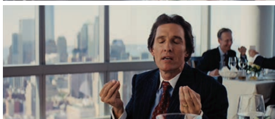
Matthew McConaughey dans THE WOLF OF WALL STREET (2013) de Martin Scorsese.

au cinéma, on ne peut que reprendre notre souffle et, ultérieurement, apprécier la justesse de l'interprétation de l'acteur, parfaitement intégrée à l'espèce d'opéra baroque qui se met alors en place. D'autres acteurs, chevronnés et dont le talent ne fait aucun doute, n'arrivent pas toujours à contrôler leur propension à cabotiner : Sean Penn en est un bon exemple. Autant peut-il jouer tout en retenue sous la gouverne de Clint Eastwood ( Mystic River ), autant échappe-t-il à la direction de Tim Robbins dans le très surfait Dead Man Walking où, ayant la bride sur le cou, Penn se déchaîne, desservant par ses outrances les nobles intentions du film. Même dans un mode plus léger et sous l'œil vigilant d'un cinéaste expérimenté, Penn peut altérer le profil de son personnage, tel qu'il me semble le faire dans Sweet and Lowdown de Woody Allen.