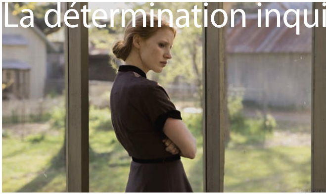
THE TREE OF LIFE (2011) de Terrence Malick.

« C e fut comme une apparition... » aurait peut-être dit Flaubert. Avec The Tree of Life , Malick nous révélait dans un rôle de mère céleste cette actrice dont la douceur cache une inquiétude enfouie. Sans parler de son visage et son corps, détachés de tout stéréotype et, bien sûr, sa roussure, qui finissent d'en faire une figure féminine atypique. Loin des « girls next door » qui peuplent le cinéma américain actuel, Jessica Chastain n'appelle pas l'identification, ni la crédibilité réaliste. Elle semble vouée aux personnages plus grands que nature, proches d'une forme d'idéal, ou de personnalités intenses.