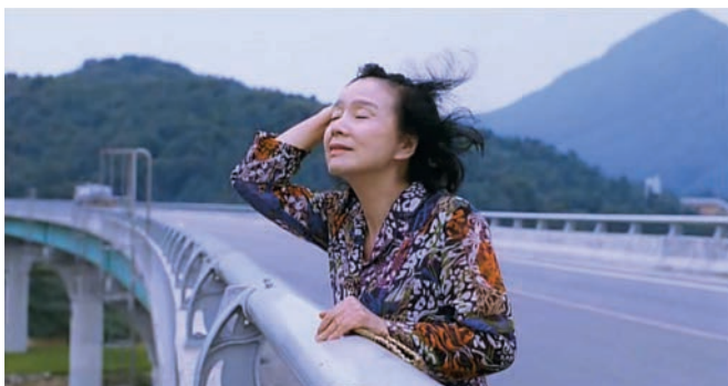
Daniel Day-Lewis dans THERE WILL BE BLOOD , Adèle exarchopoulos dans LA VIE D'ADELE d'Abdellatif Kechiche et Yoon Jeong-hee dans POETRY de Bong Joon-ho