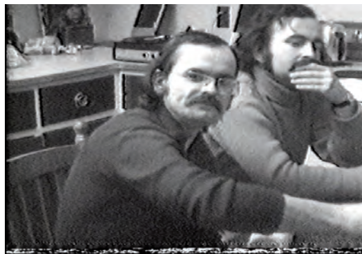
LE TEMPS D'UNE PRIÈRE, ENTRÉE EN SCÈNE (reportage vidéo de Robert Forget) et VIDÉOGRAPHE, VU ET PAR

pour interroger ces jeunes, discuter avec eux en se rendant à certains endroits. Jutra l'a utilisé et exploité de façon concluante. Pour Wow , toute la phase de recherche s'est faite avec un magnétoscope portatif, alors que l'entrée de la vidéo à l'ONF était systématiquement refusée par les services techniques qui considéraient cet appareil comme un jouet. On avait beau leur expliquer qu'il combinait le magnétophone à cassette et le polaroid, en plus d'intégrer le mouvement, ils en avaient peur. »