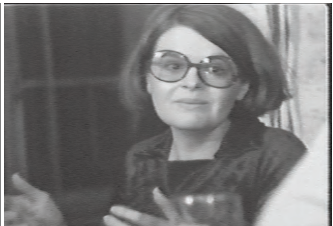
Archives Vidéo Femmes

de production et de services mis en commun, elles s'associent en 1977 avec d'autres groupes populaires pour fonder le Centre Populaire d'Animation Audio-Visuelle de Québec (le CPAAVQ qui deviendra La Bande vidéo et film de Québec en 1986). Ce centre est orienté vers l'action et l'intervention dans les milieux populaires, qui sont les publics visés en même temps que les «acteurs» des vidéogrammes de l'époque. Nous retrouvons l'esprit qui règne alors au sein du groupe «Le centre la femme et le film» à la lecture de ces lignes :