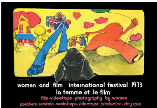
Affiche de «La femme et le film», UNE NEF... ET SES SORCIÈRES d'Hélène Roy