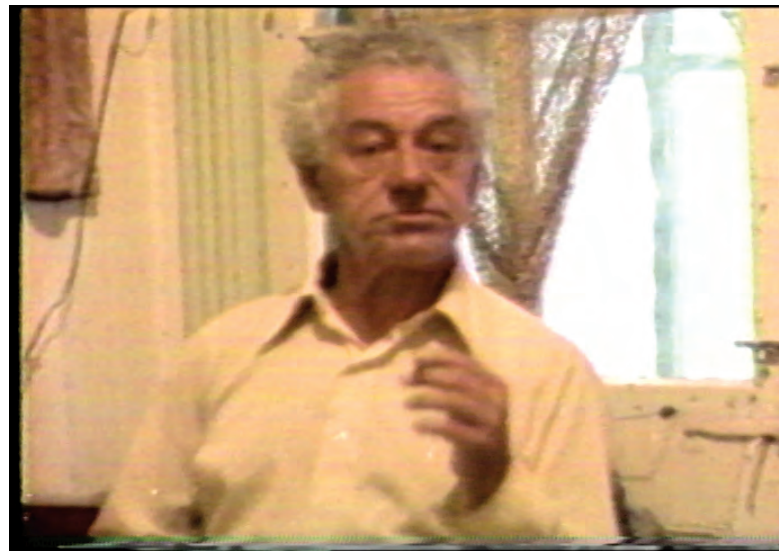
LE VOLEUR VIT EN ENFER de Robert Morin

« L'indépendance, ça tient à quoi? Ça tient au fait que tu veux aller au bout d'une idée de la production, mais vraiment au bout, avec les moyens requis pour aller jusqu'au bout, sans que personne n'intervienne pour te dire: "Tu devrais pas faire ça comme ça"... ou "tu devrais pas dire ça". À la limite, c'est ça l'indépendance, le reste on s'en fout. » ■