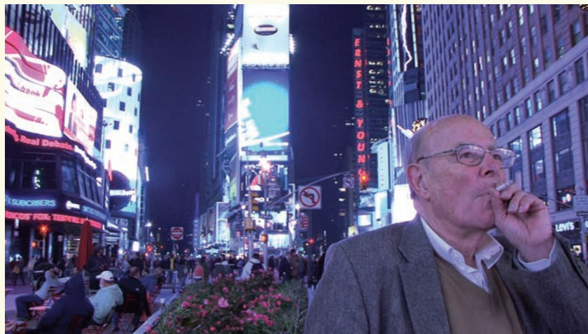
UN VOYAGEUR de Marcel Ophuls

LE DOCUMENTAIRE N'EST JAMAIS AUSSI PERTINENT QUE LORSQUE, LOIN DE FEINDRE LE TON OBJECTIF DE CELUI qui délivre savoir et information, il revendique pleinement une subjectivité de toute façon inévitable. Trois films programmés pendant le Festival de Cannes à quelques jours d'intervalle l'ont rappelé avec éclat, confirmant aussi qu'il y a mille et une façons de dire « je » selon qu'on s'appelle Claude Lanzmann, Marcel Ophuls ou Rithy Panh, trois cinéastes dont les œuvres passées ont en commun l'exploration des pages parmi les plus douloureuses de l'histoire du vingtième siècle.