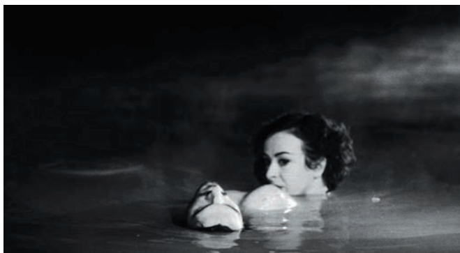
DHARMA GUNS (2010) de FJ. Ossang, une promenade au cimetière des genres.

désire d'ailleurs acquérir, au passage, les droits de la série qu'il croit pouvoir revamper au goût du jour : « A hard, cynical act for a hard, cynical world. » Kermit et sa bande symbolisent ici la naïveté perdue d'une culture populaire supposément démodée, son caractère foncièrement anachronique étant d'ailleurs décuplé par la matérialité qui place ces personnages aux antipodes des créations numériques actuelles telles que le Wall-E de Disney. Le petit robot fait d'ailleurs une brève apparition dans le film ; incarné