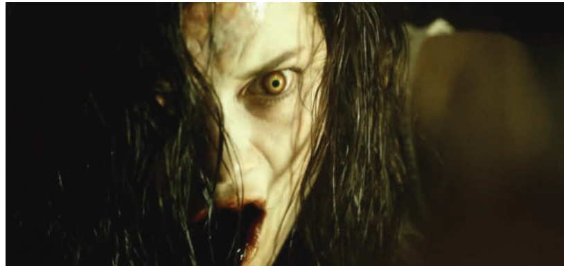
SKYFALL (2012) de Sam Mendes et EVIL DEAD (2013) de Fede Alvarez

LE CINÉMA CONTEMPORAIN SEMBLE ÉPRIS D'UN SOUVENIR INDISTINCT, INCERTAIN, QU'IL N'ARRIVE PAS exactement à définir – mais qu'il évoque avec de plus en plus d'insistance. Trop fréquemment appréhendée en tant qu'expression réactionnaire d'un rejet du présent, la nostalgie s'impose aujourd'hui non pas comme un courant aux contours définis mais comme un état d'esprit, un lieu commun du cinéma contemporain qui pourrait, à bien y penser, se révéler un nouveau lieu de résistance. Car c'est à l'émergence d'une authentique poétique mélancolique, allant au-delà d'un simple fétichisme des formes passées, qu'il faut se rendre à l'évidence que nous assistons actuellement. Peut-on s'affranchir de l'air du temps sans arrêter de penser son époque? Giorgio Agamben, dans Qu'est-ce que le contemporain? affirme que « le contemporain n'est pas seulement celui qui, en percevant l'obscurité du présent, en cerne l'inaccessible lumière; il est aussi celui qui, par la division et l'interpolation du temps, est en mesure de le transformer et de le mettre en relation, de lire l'histoire d'une manière inédite, de la « citer » en fonction d'une nécessité qui ne doit absolument rien à son arbitraire, mais provient d'une exigence à laquelle il ne peut pas ne pas répondre. » (p. 39)