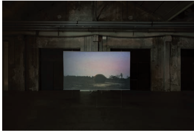
MAKING OF THE SPACESHIP et A DEDICATED MACHINE deux des vidéos qui composent PRIMITIVE (en bas, au Hangar Bicocca de Milan)

les extirper du refoulement et de l'oubli avant leur extinction, afin qu'elles puissent s'incarner autrement et permettre de repenser le monde. Dans le cas de Primitive on cherche, par la création de différents scénarios fictifs, à « implanter une mémoire » dans un lieu où les souvenirs sont éteints 2 . À travers Uncle Boonmee c'est du cinéma qu'Apichatpong désire se souvenir, en rendant hommage aux films qui ont marqué son enfance et qui aujourd'hui tombent dans l'oubli, les films thaïs en 35 mm à grand déploiement autant que les films aux décors de carton-pâte ou les feuilletons télévisés 3 .