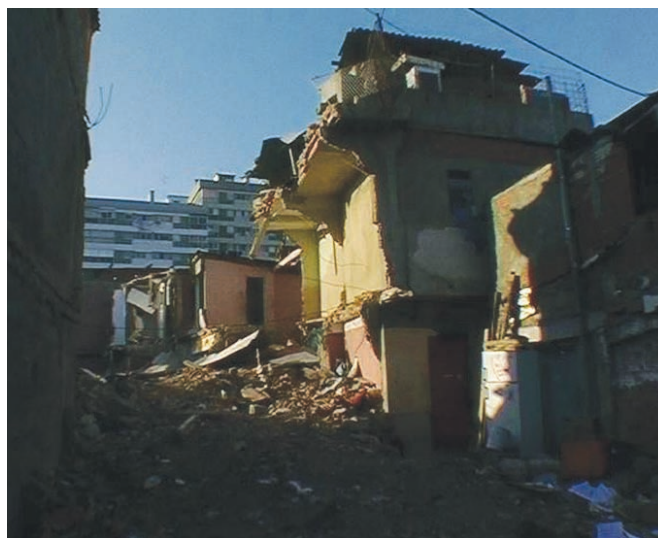
Dans la chambre de Vanda (2000)

ainsi, grâce à sa manière de pratiquer le cinéma en s'immergeant dans le quotidien de ceux qu'il filme, un visage inédit des villes contemporaines, qui n'est en fait que la configuration d'un nouveau monde en train de se dessiner et que nous ne savons pas encore voir. Un monde où Ventura refuse d'être un mutant, tout en ayant pour seule arme sa résistance silencieuse et butée devant la perspective de plus en plus inéluctable de son déménagement. C'est pourquoi Costa a choisi, pour son troisième et dernier film tourné à Fontainhas, de s'attacher à suivre cet homme qui, tel un spectre errant, traîne son désarroi entre la cité anonyme où se trouve la nouvelle chambre de Vanda, où il vient échouer jour après jour pour écouter le monologue ininterrompu de la jeune femme, et ce qui reste de son quartier avant sa disparition 3 .