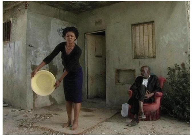
En avant, jeunesse!