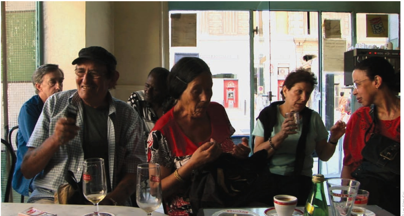
La république (de la série « La république Marseille »)