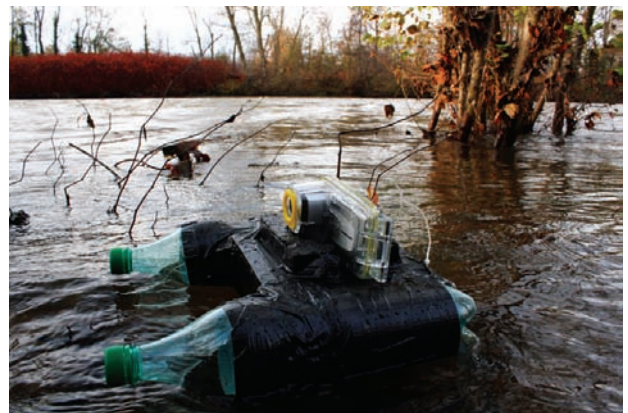
L'œil de la rivière (2009) de Michel Coste

vidéo-cinétique qui fait évoluer deux caméras d'observation (ou de surveillance) en circuits fermés selon de lentes révolutions hypocycloïdales. Les images sont projetées en temps réel sur deux immenses écrans juxtaposés. « Je tente ainsi de renouveler la perception que nous nous faisons de nous-mêmes, des autres et du milieu qui nous entoure, d'en révéler l'étrangeté, la pro-