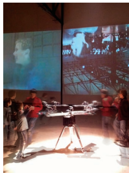
Le cosmos dans lequel nous sommes (2010) de Pascal Dufaux